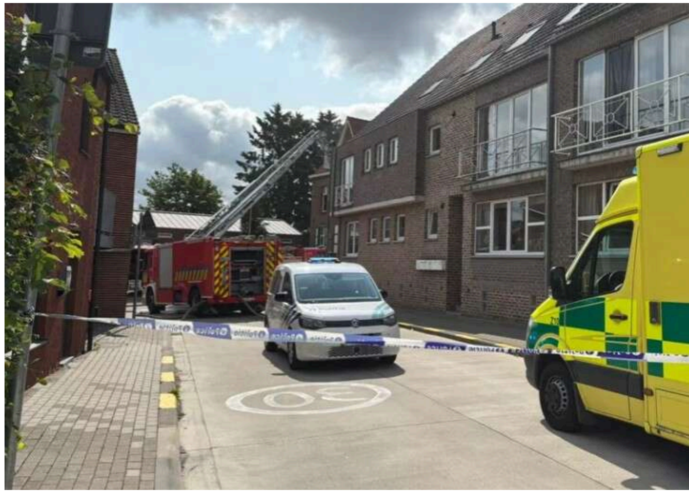
У Бельгії в місті Хаасроде почали розслідування подвійного вбивства українок - ЗМІ

У місті Хаасроде, Бельгія, правоохоронці відкрили справу за фактом вбивства двох осіб – жінки та її шестирічної доньки. Обидві постраждали від ножового нападу, мати загинула на місці події, а дочка згодом померла у лікарні.