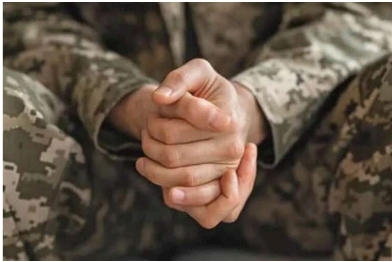
Журналіст оприлюднив тривожну статистику дезертирства в українській армії в 2025 році

Читати на руськом Read in English Додати як бажане джерело в Google