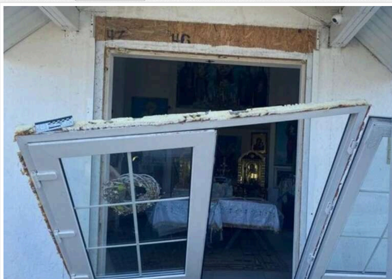
На Одещині росіяни пошкодили церкву дронами

У ніч на 7 червня росіяни атакували Одеську область ударними безпілотниками. У результаті атаки було пошкоджено будівлю храму та іншу інфраструктуру селища Овідіополь.