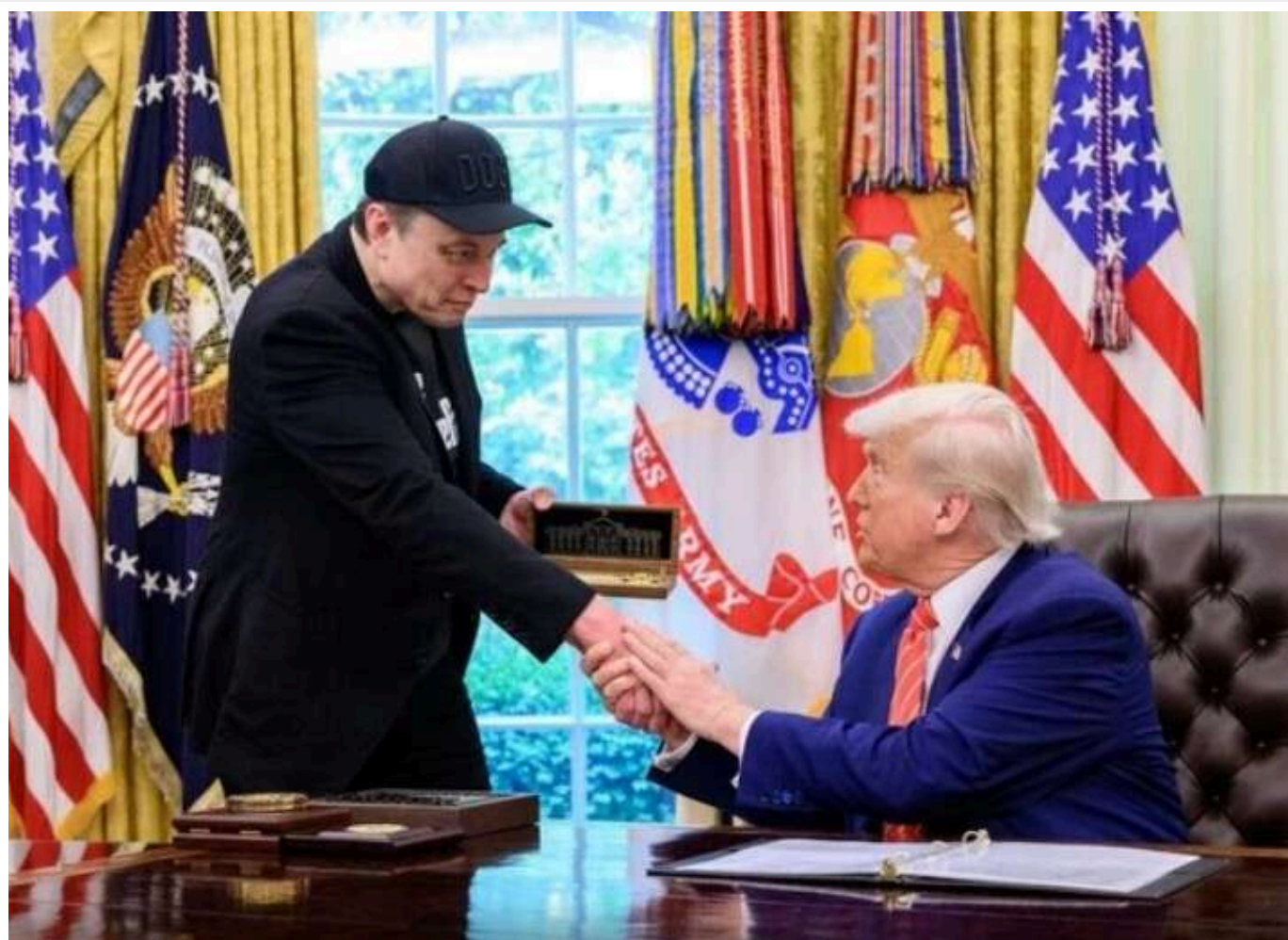
Маск може позбутися мільярдних субсидій через суперечку з Трампом

Президент США Дональд Трамп не виключає можливості перегляду державних контрактів підприємця Ілона Маска з урядом на тлі публічного конфлікту між ними. Це може потенційно зачепити великі проекти компаній бізнесмена, зокрема SpaceX і Tesla.