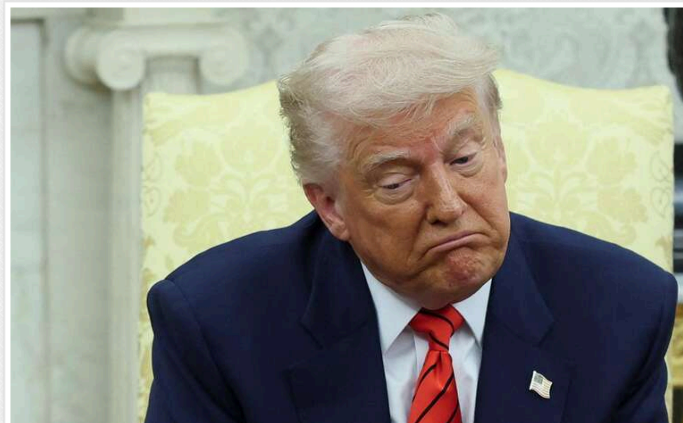
Україна сама спровокувала російські удари, - Трамп