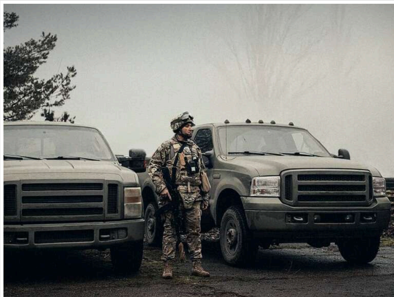
Рекордні 3,3 мільярди на дизель: «Агенція оборонних закупівель» підписала найдорожчий контракт на пальне з 2024 року

ДП МОУ «Агенція оборонних закупівель» 27 травня за результатом торгів замовило в АТ «Укрнафта» дизельне пальне на 3,32 млрд грн.