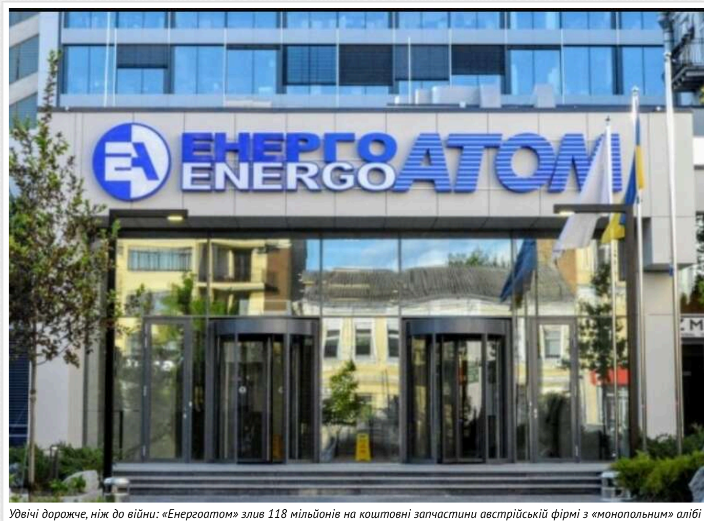
Удвічі дорожче, ніж до війни: «Енергоатом» злив 118 мільйонів на коштовні запчастини австрійській фірмі з «монопольним» алібі

Читати на руськом Додати як бажане джерело в Google