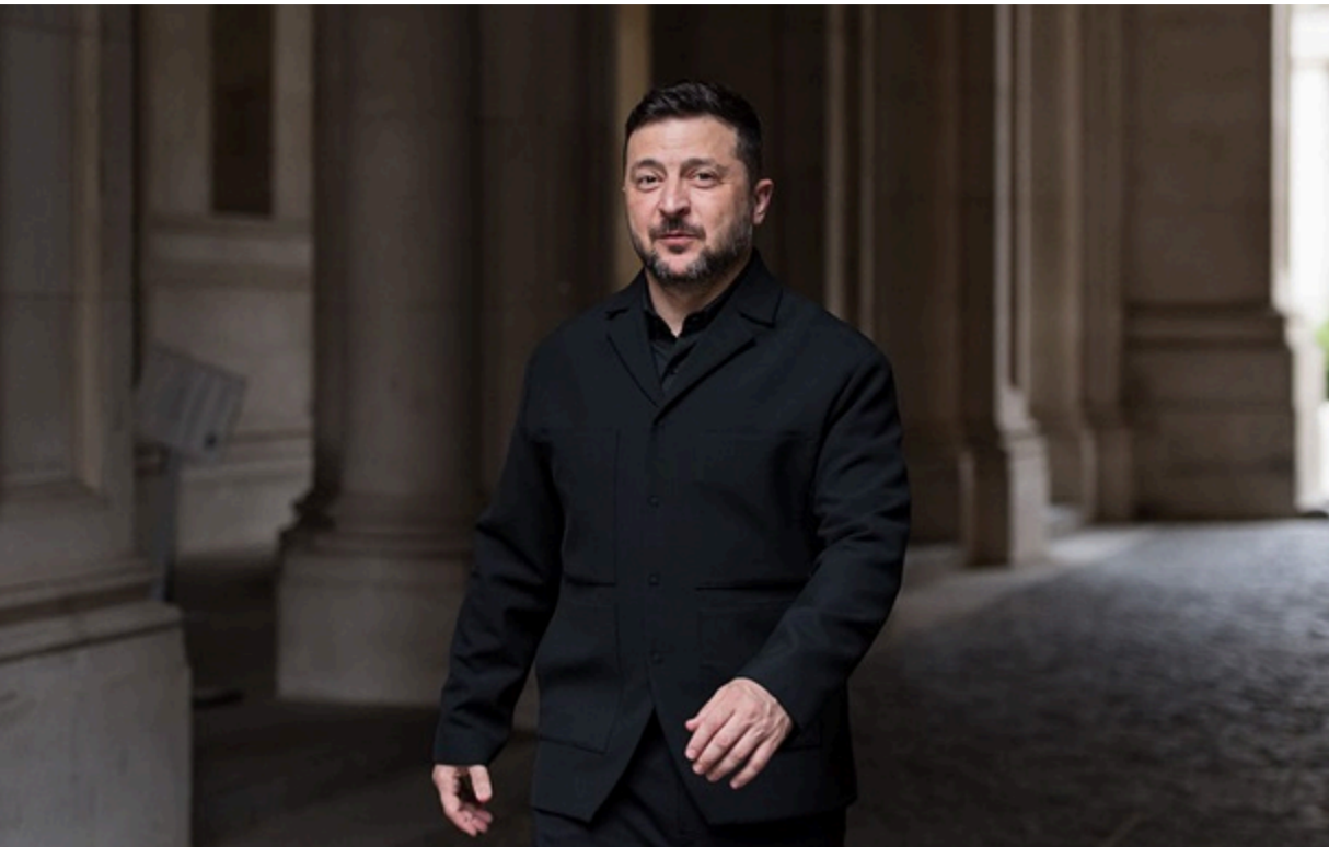
З початку року Україна поступово перехоплює ініціативу в окремих ділянках війни

Адміністрація Дональда Трампа демонструє дещо двоїстий, але прагматичний підхід до переговорного процесу.