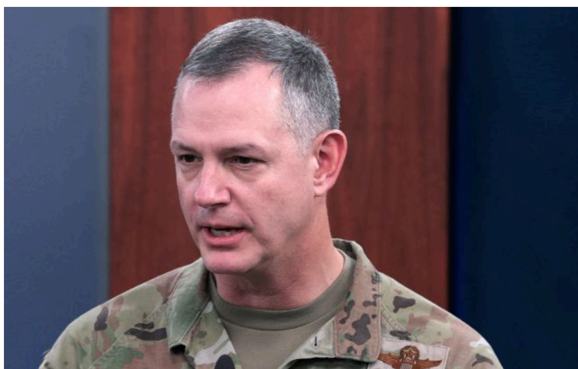
Фото: генерал НАТО Алексус Гринкевич (Getty Images)