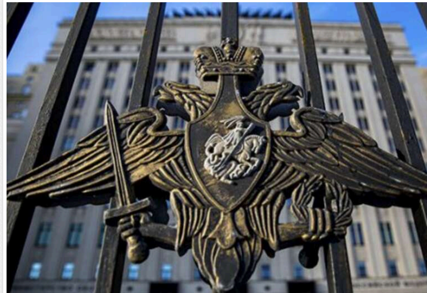
Міністерство оборони РФ: «Відповіли на теракти» - мирні міста України тепер «офіційні цілі»

Масштабний удар російської армії по мирних містах України став "відповіддю на теракти".