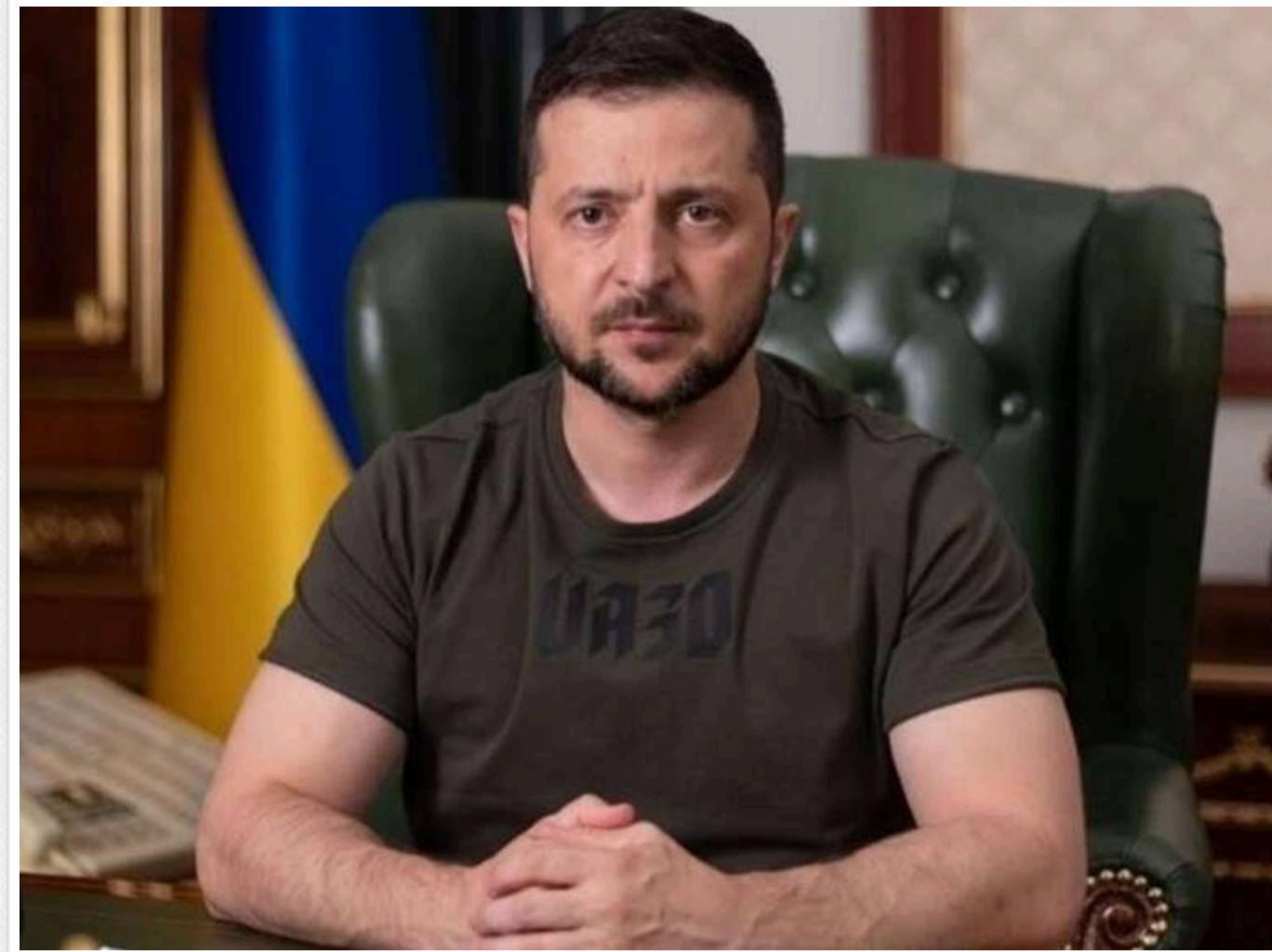
Зеленський третю добу натякає на співучасть Трампа в російських ударах

Президент України Володимир Зеленський вже третій день поспіль натякає на співучасть президента США Дональда Трампа у російських ударах по Україні.