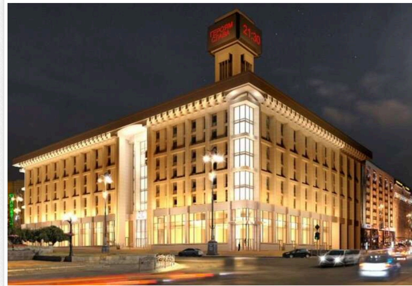
Держава повернула контроль над Будинком профспілок: арешт подвоєно після спроби рейдерства

Національне агентство з розшуку та менеджменту активів (АРМА), Офіс Генерального прокурора та Державне бюро розслідувань успішно відстояли державні інтереси, знову домігшись арешту Будинку профспілок. Це стало можливим після того, як Печерський районний суд Києва 3 червня прийняв рішення про часткове зняття арешту з цього майна, що належить Федерації профспілок України. Інформація з'явилася на тлі недавніх новин про спробу рейдерського захоплення будівлі.