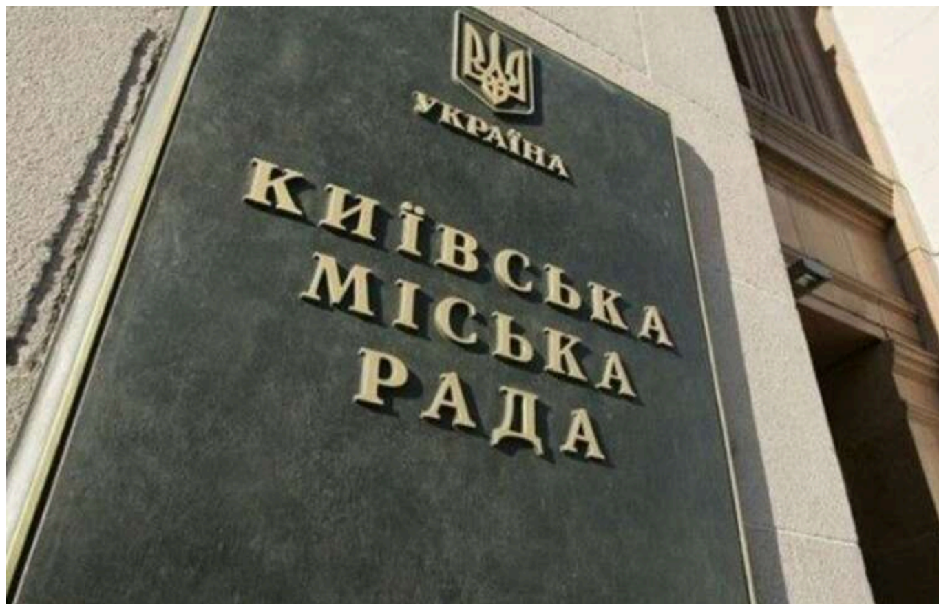
«Туалетні» схеми в Київграді: жоден член земельної комісії не натиснув «проти», дев'ять - підтримали всі 15 рішень

Жоден з депутатів Київграді, хто входить до "земельної" комісії, не голосував "проти" так званих "туалетних" схем із виведення комунальної землі з власності міста. Ба більше, дев'ятеро з її членів підтримали геть усі 15 голосувань, результати яких нині намагається скасувати міська рада столиці. Голосували "за", не вагаючись ані на партійну приналежність (опозиційна "Слуга народу" підтримала більшість схем), ані на статус депутата.