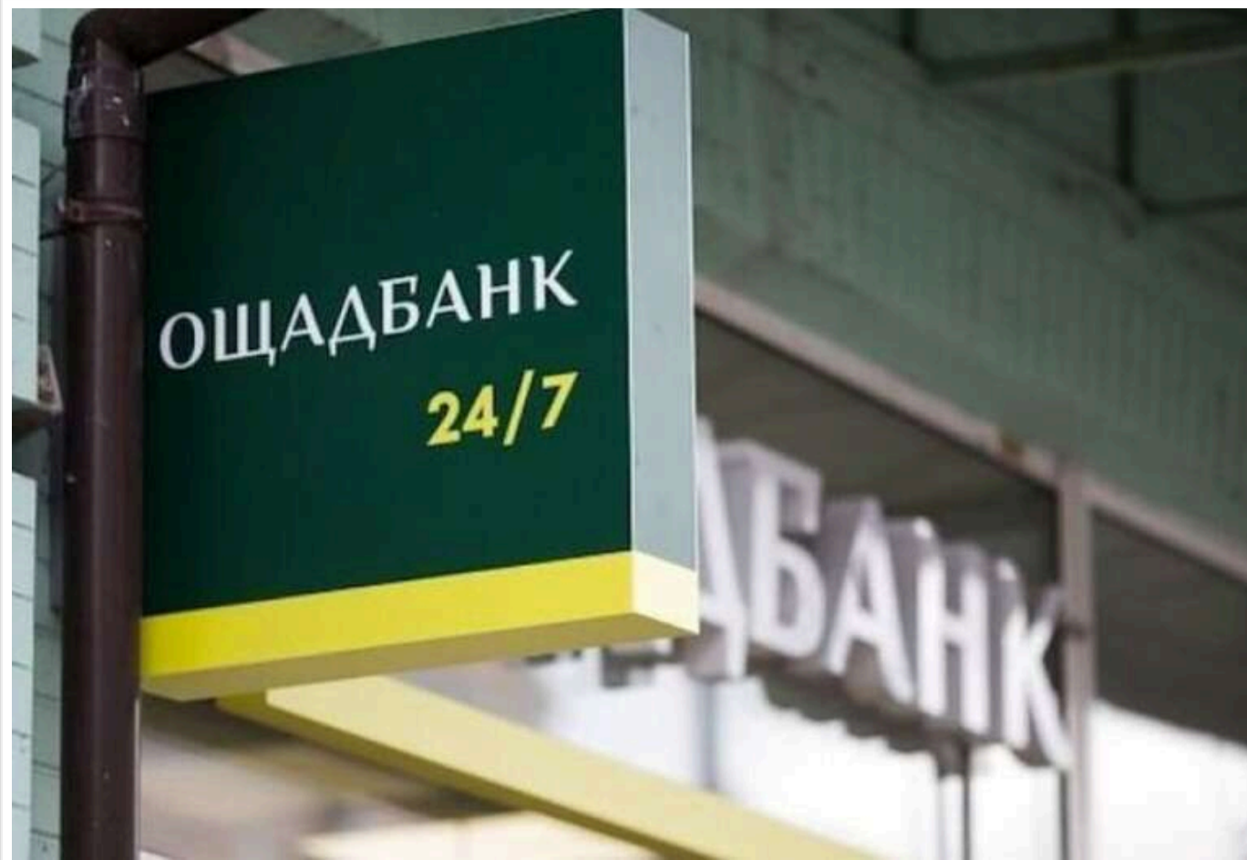
Ощадбанк витратить понад 29 мільйонів гривень на онлайн-рекламу та SEO: просуватиме кредити, банківські послуги та себе як роботодавця

Читати на руськом Додати як бажане джерело в Google