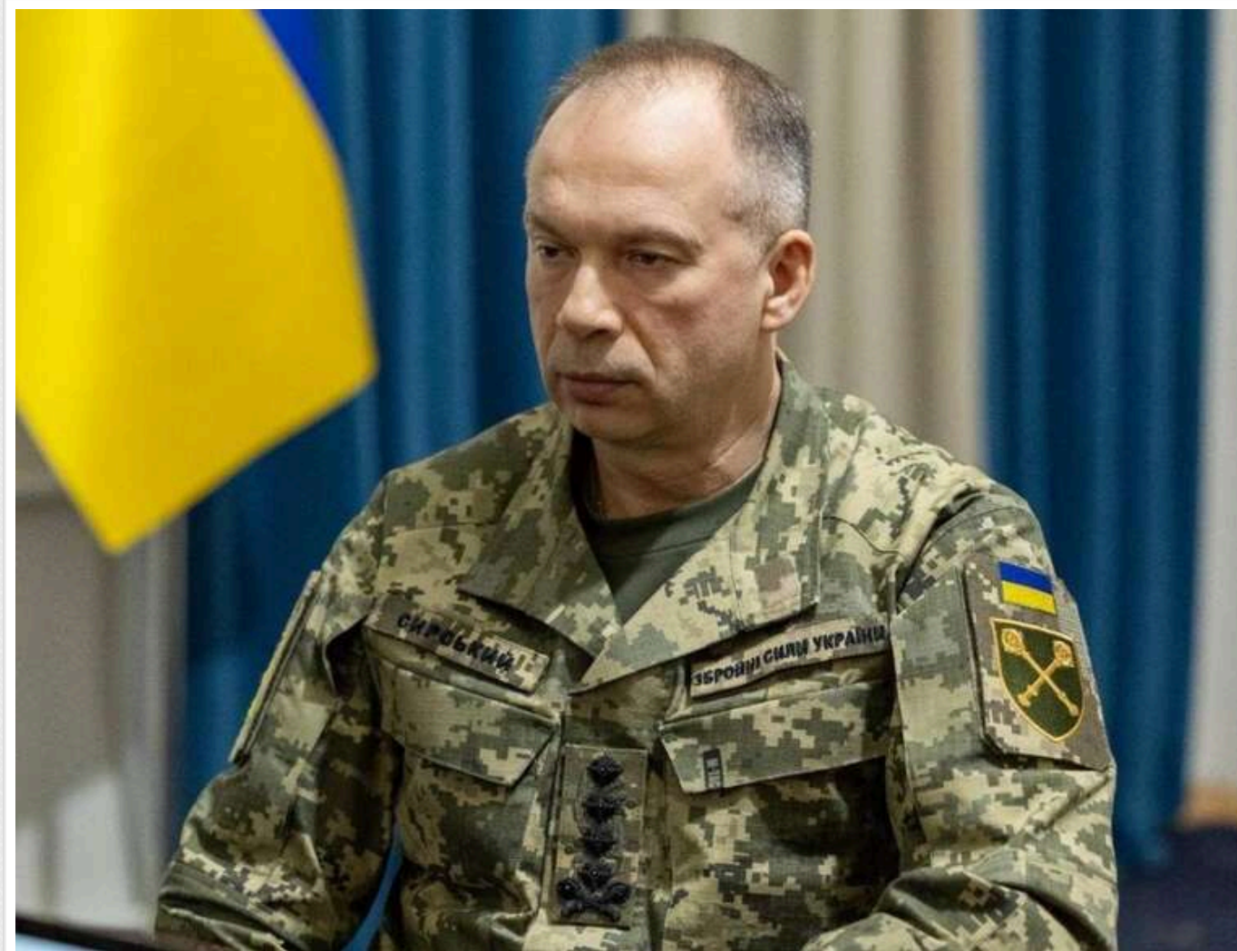
Сирський повідомив очільника Військового комітету ЄС про ситуацію на фронті

Головнокомандувач Збройних сил України Олександр Сирський поінформував голову Військового комітету Європейського Союзу, генерала Шона Кленсі про поточну ситуацію на лінії зіткнення та хід бойових дій.