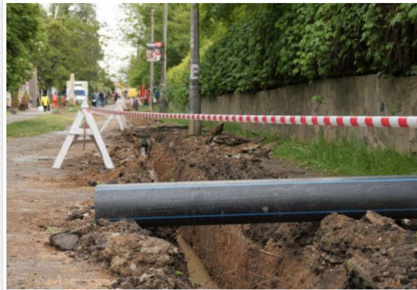
Європейський Союз надав 30 мільйонів євро на відновлення системи водопостачання в Кривому Розі

Європейський Союз оголосив про надання 30 млн євро на підтримку відновлення системи водопостачання в Кривому Розі, яка постраждала після знищення Росією Каховської греблі у 2023 році.