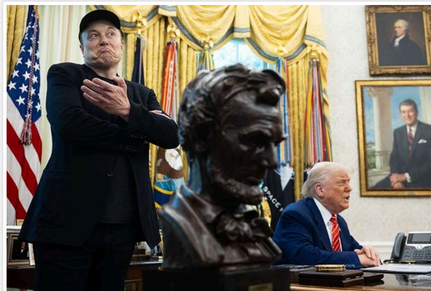
Конфлікт між Трампом і Маском загрожувє Республіканській партії та місіям SpaceX, - ЗМІ

Американські ЗМІ активно обговорюють публічне загострення конфлікту між Дональдом Трампом та Ілоном Маском, яке сталося напередодні.