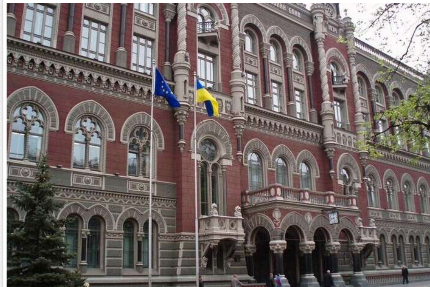
Нацбанк зберіг облікову ставку, але побачив ризик щодо міжнародного фінансування України

Національний банк ухвалив рішення зберегти свою облікову ставку на попередньому рівні у 15,5% річних, про що сьогодні оголосив голова НБУ Андрій Пишний.