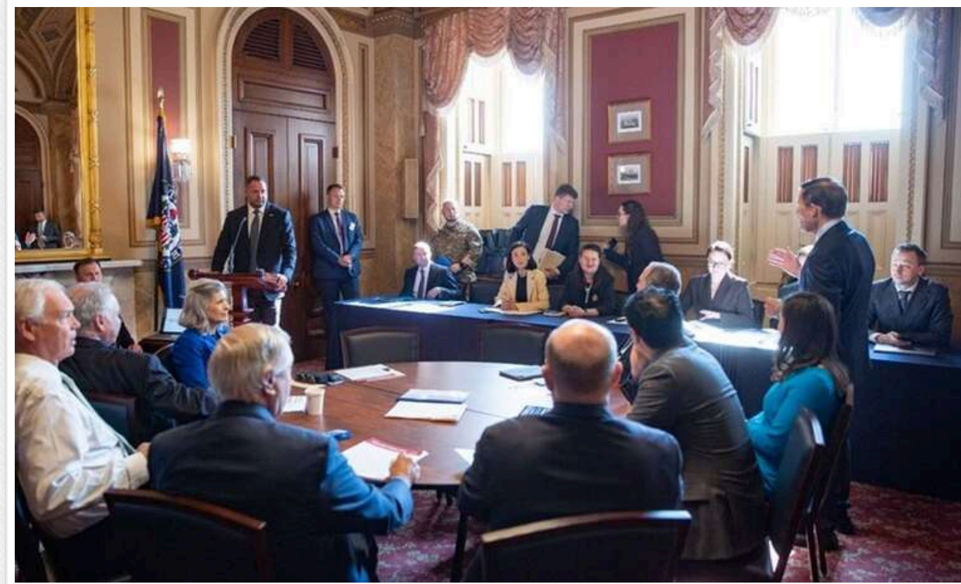
Єрмак і Паліса закликали сенаторів США підтримати санкції проти РФ: «Ми не програємо війну»

Читати на руском Read in English Додати як бажане джерело в Google