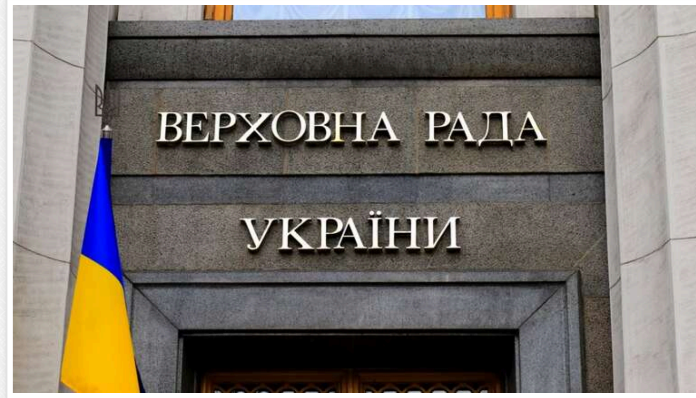
Верховна Рада підтримала законопроект, який полегшить визнання зниклих безвісти померлими

Верховна Рада ухвалила в першому читанні законопроект №12451, який має врегулювати строки оголошення судом зниклих безвісти через воєнні дії померлими.