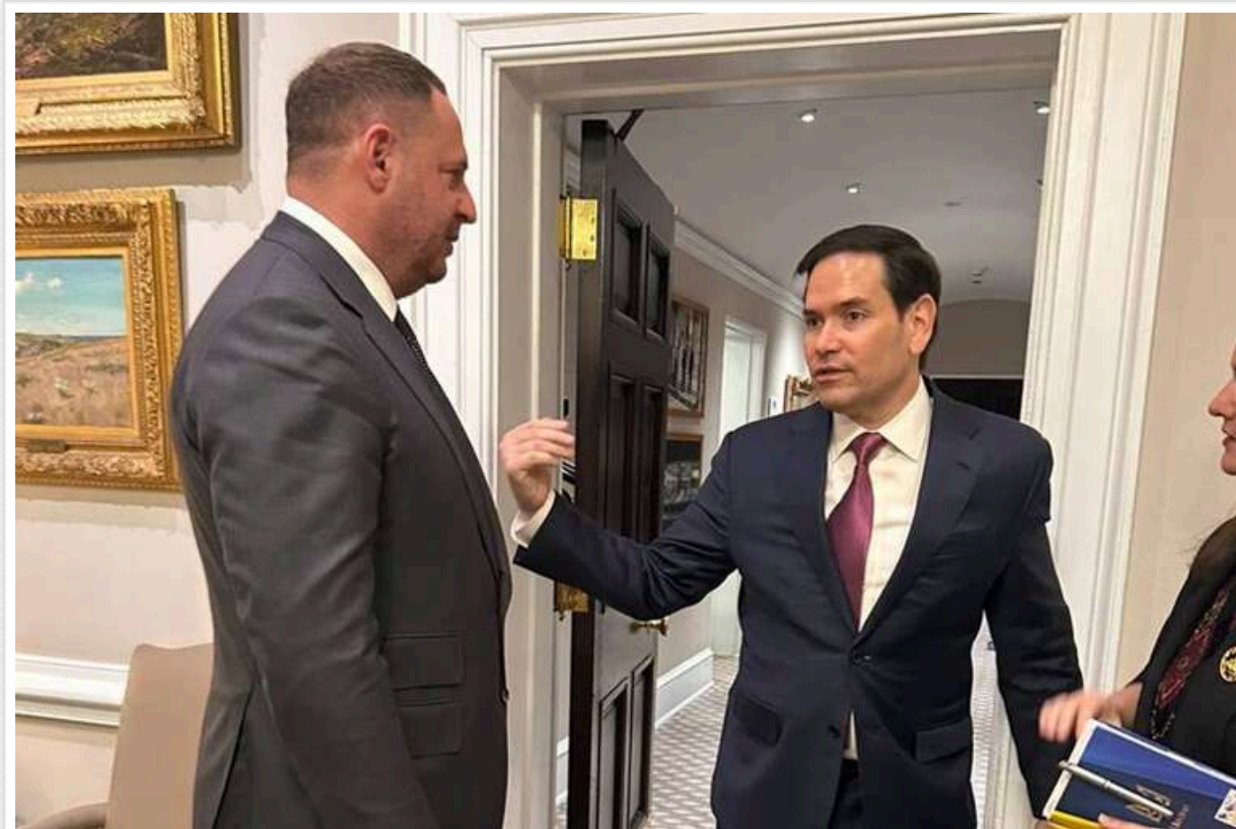
Єрмак обговорив з Рубіо переговори у Стамбулі та посилення української ППО

Керівник Офісу Президента України Андрій Єрмак під час свого візиту до Вашингтона зустрівся з Державним Секретарем США Марко Рубіо. Вони обговорили необхідність зміцнення української ППО та переговори з Росією в Стамбулі.