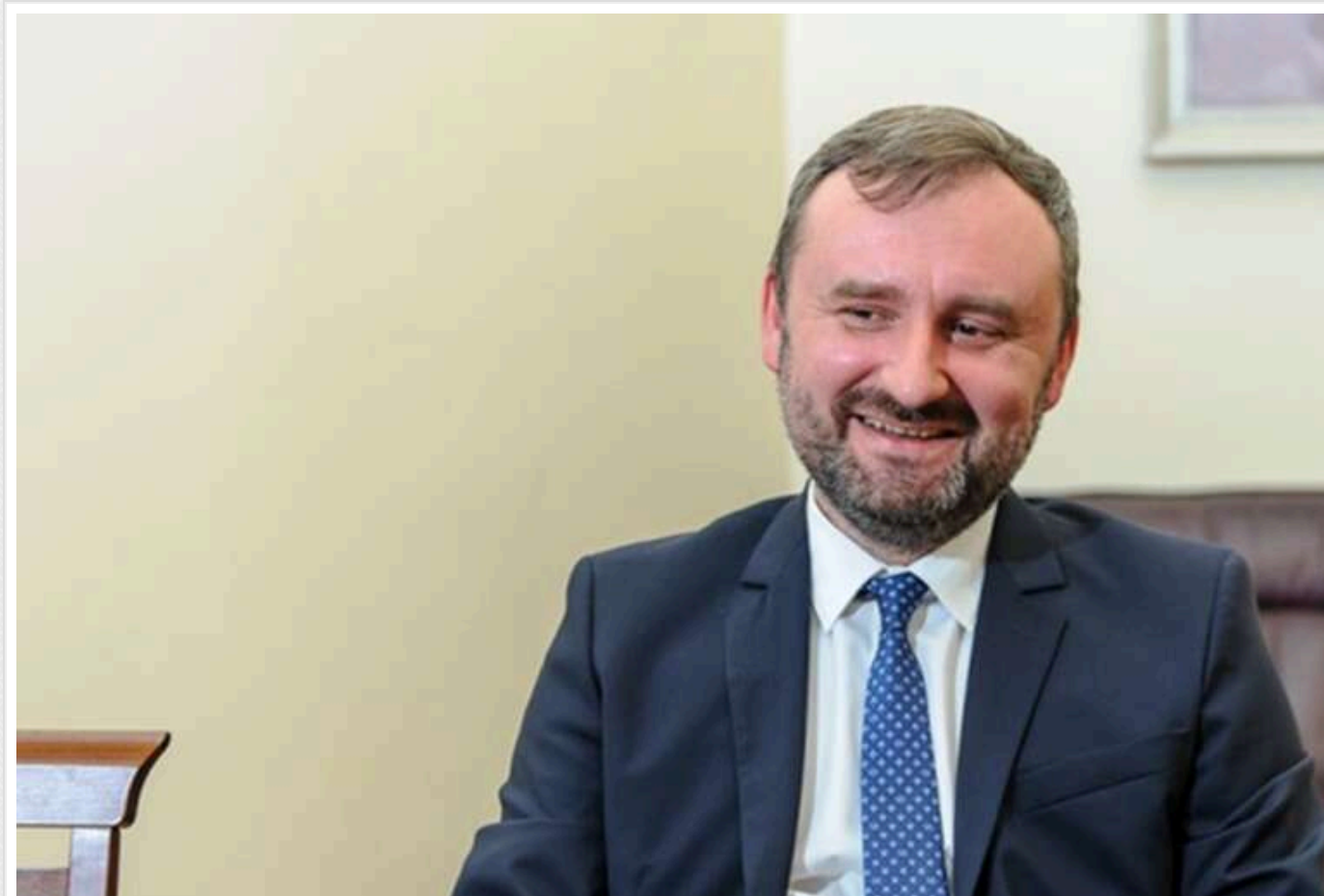
Заступник голови НБУ Мазутка задекларував елітну нерухомість у Греції та США, оформлену на дружину

Заступник голови Національного банку Ярослав Мазутка задекларував на дружину будинок і квартиру в Греції.