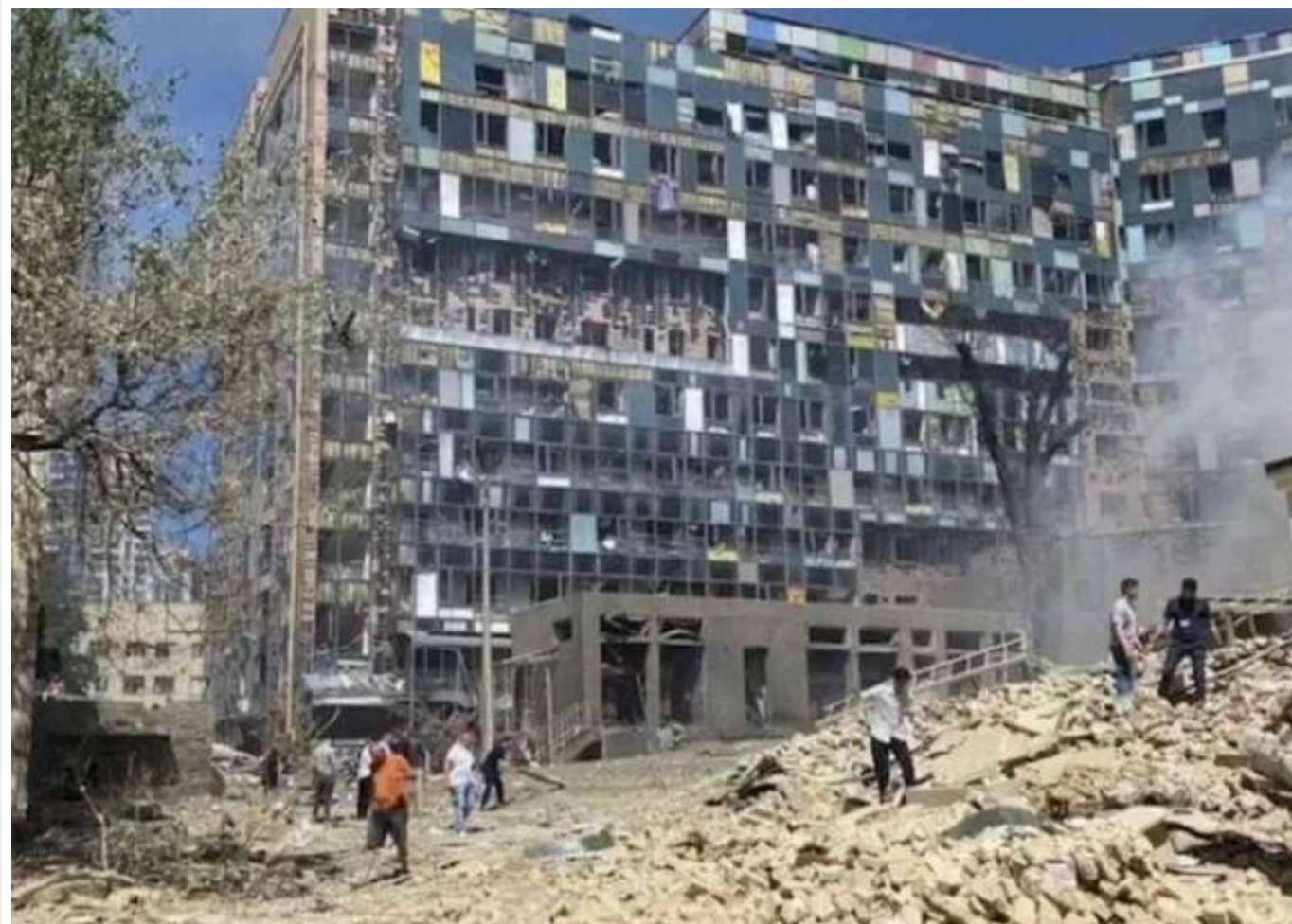
Компанія із сумнівною репутацією виграла тендер на ремонт «Охматдиту» на суму майже 300 мільйонів гривень

Національна дитяча спеціалізована лікарня «Охматдит» оголосила тендер для ремонту будівлі після обстрілу російськими військами в липні 2024 року. Контракт було підписано з ТОВ «РІОЛА-МОДУЛЬ ЛТД» на суму майже 300 млн грн. Ця компанія чотири рази звинувачувалася у розкраданні державних коштів у змові з чиновниками Сумської та Донецької областей.