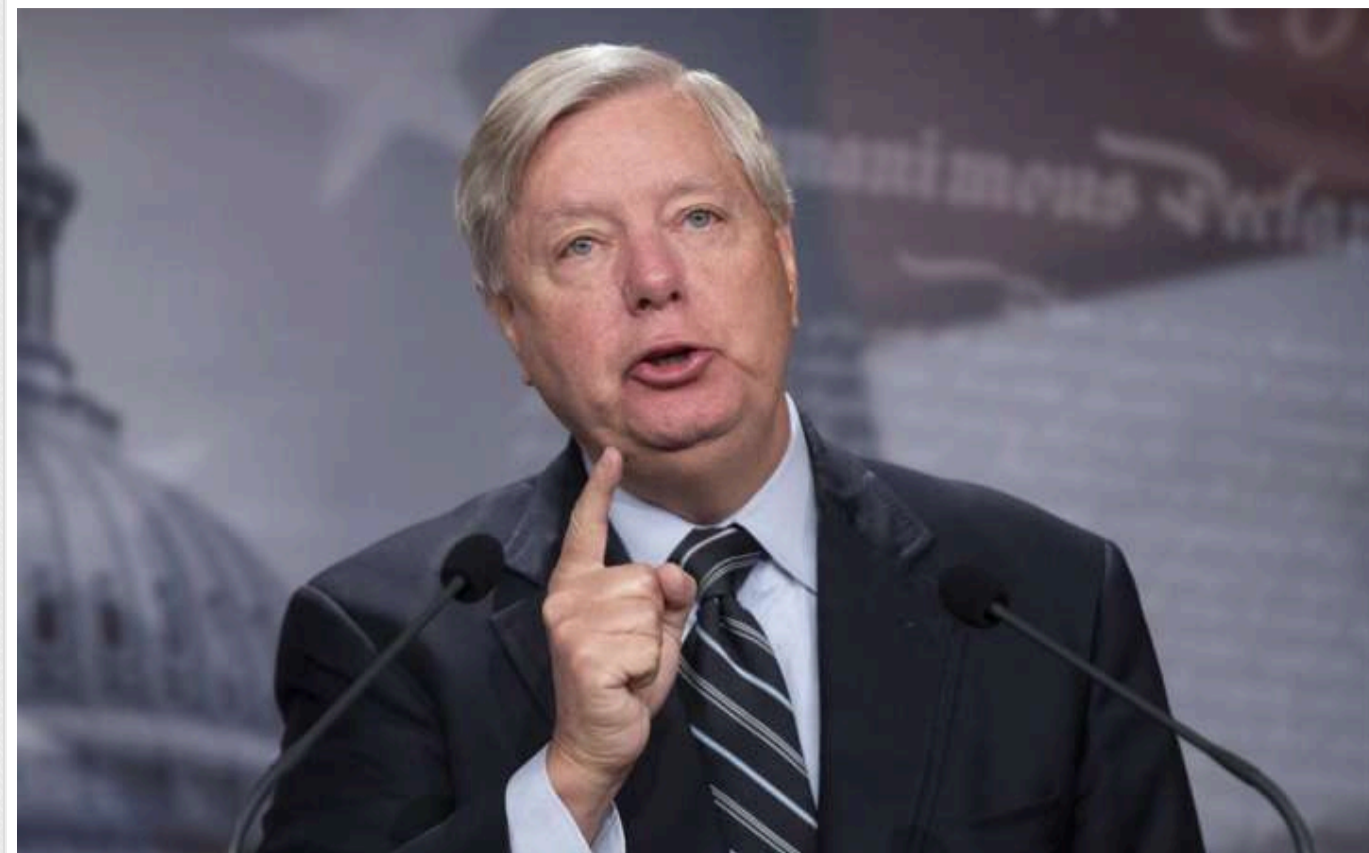
Сенатор Грем: Залишити Україну - гірше, ніж відхід США з Афганістану

Сенатор Грем заявив, що якщо ця війна закінчиться так, наче ми залишили Україну, – це буде навіть гірше, ніж виведення американських військ з Афганістану.