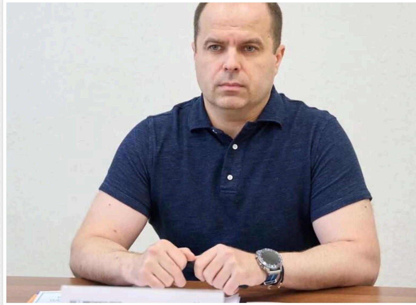
Сестра заступника генпрокурора отримала елітну квартиру в Києві в подарунок від пенсіонера-сусіда - розслідування

Читати на руском Read in English Додати як бажане джерело в Google