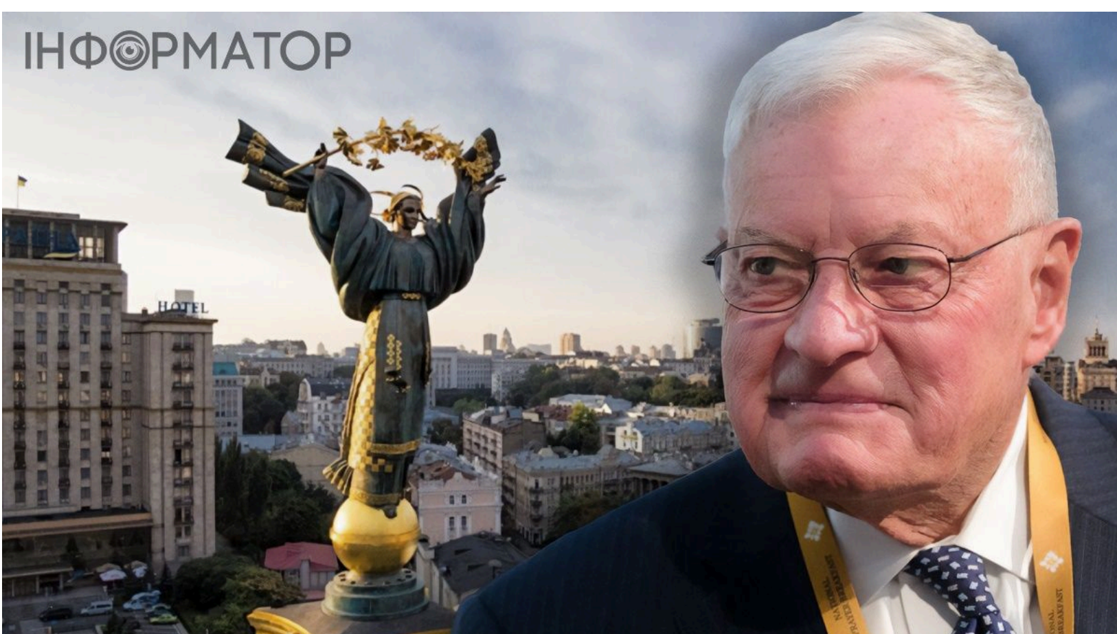
Келлог назвав паузу в переговорах між Україною та РФ "доброю новиною"

Колишній спецпосланець президента США у справах України Кіт Келлог назвав "доброю" ситуацію, за якої мирний процес між Києвом та Москвою фактично зупинився. Напередодні президент Фінляндії Стубб відмовився від ролі переговорника , пославшись на те, що цим мають займатися провідні держави Європи. Заяву пов'язано з тим, що американські посередники - Стів Віткофф і Джаред Кушнер - наразі зосереджені на діалозі з Іраном. Саме тому Вашингтон тимчасово відійшов від українського треку.