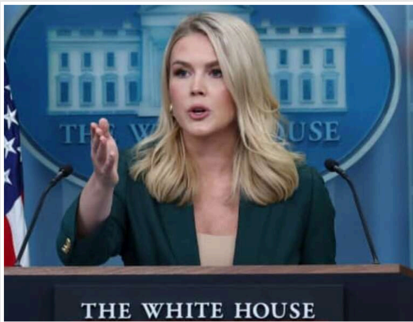
У Трампа не знають, чи з'явилися у Зеленського "нові карти" після удару БЛЛА по авіабазах РФ

Президент США Дональд Трамп ще не висловився з приводу ударів українських безпілотників по військових авіабазах РФ у межах спецоперації "Павутина", яка призвела до знищення третини російської стратегічної авіації. Наразі невідомо, чи змінює він свою думку щодо "козирів" президента Володимира Зеленського.