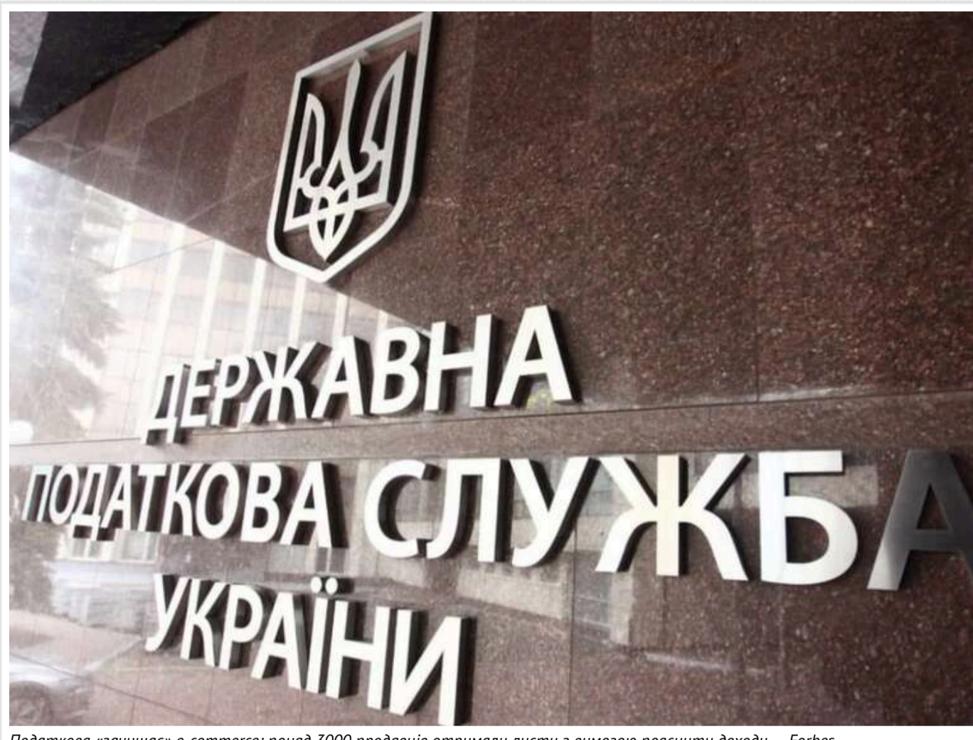
Податкова «зачищає» е-commerce: понад 3000 продавців отримали листи з вимогою пояснити доходи – Forbes

Читати на руськом Read in English Додати як бажане джерело в Google