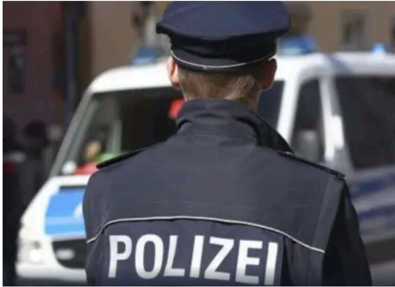
У Кельні евакуюють 20 тисяч осіб через знайдені авіабомби часів Другої світової війни

У німецькому місті Кельні 2 червня під час розвідувальних робіт виявили три нерозірвані американські авіабомби часів Другої світової війни. Через це з цієї території евакуюють приблизно 20 тисяч мешканців.