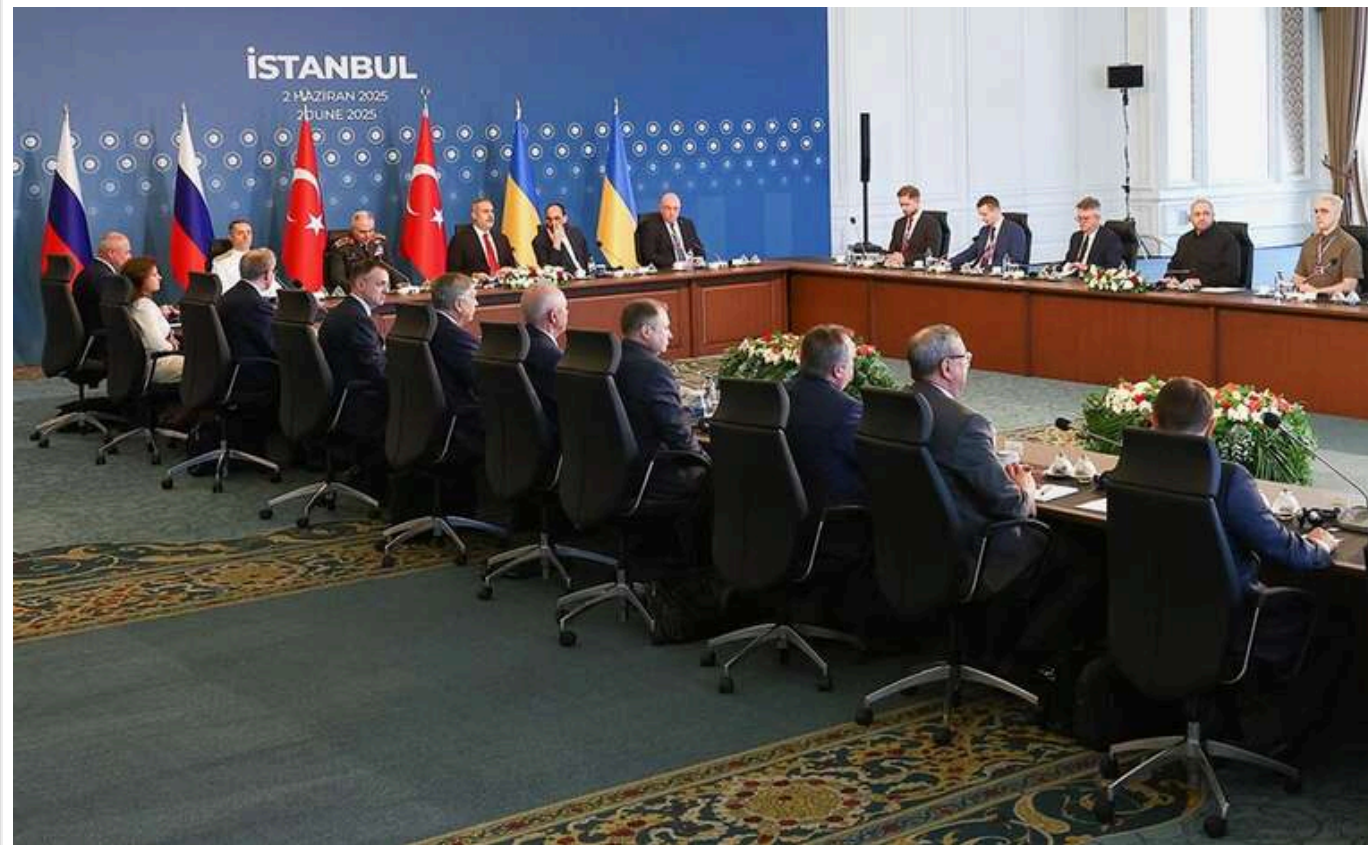
Що стоїть за вимогами Кремля: В ISW оцінили результат перемовин у Стамбулі

2 червня українська та російська делегації зустрілися в Стамбулі та домовилися лише про обмін військовополоненими. Росія не погодилася надати свій "меморандум" з умовами мирного врегулювання війни до зустрічі, що в результаті зробило її безрезультатною та ще більше затягнуло переговорний процес.