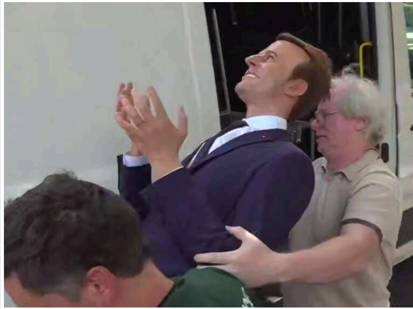
Активісти Greenpeace викрали воскову фігуру Макрона і поставили біля посольства РФ у Парижі

Троє активістів Greenpeace влаштували акцію протесту, викравши з паризького музею Гревен воскову фігуру президента Франції Емманюеля Макрона.