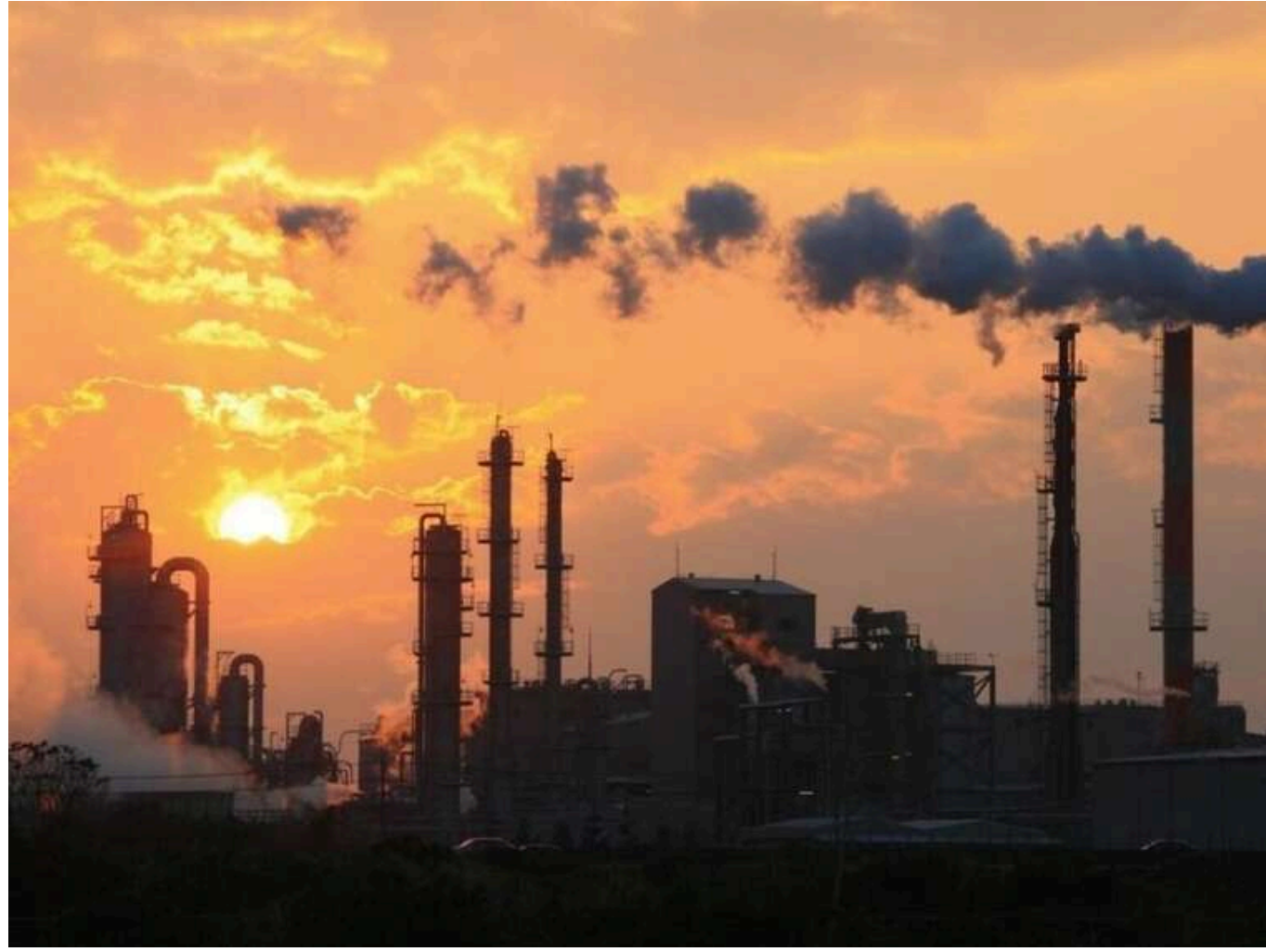
Промислове виробництво в Україні прискорило спад у першому кварталі 2025 року, — Гетманцев

Спад у промислому виробництві України в першому кварталі 2025 року прискорився до 6,1% порівняно з 4,8% у січні.