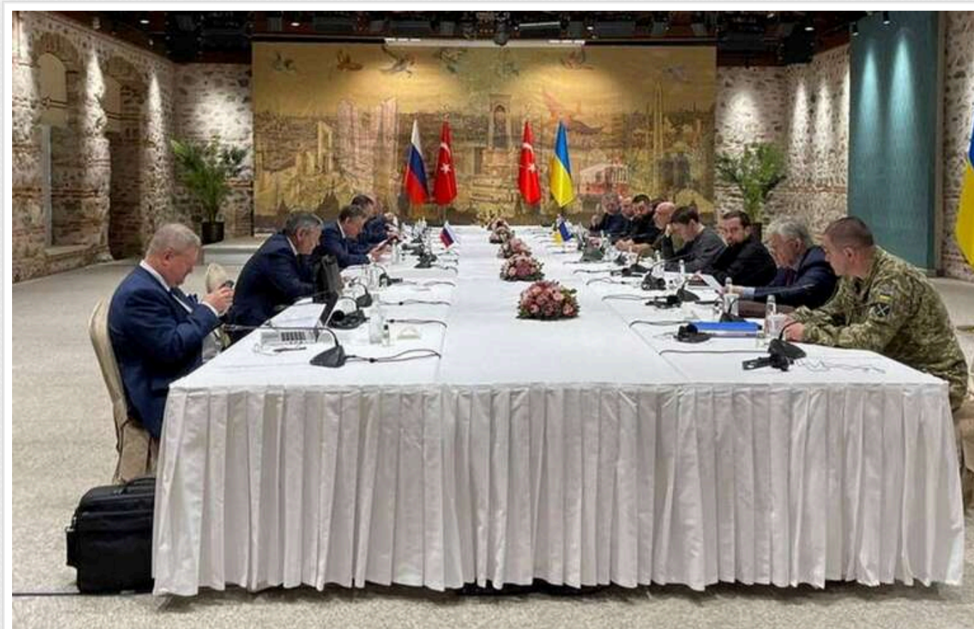
Переговори в Стамбулі: з'явився повний текст українського меморандуму з умовами миру

Читати на руском Read in English Додати як бажане Джерело в Google