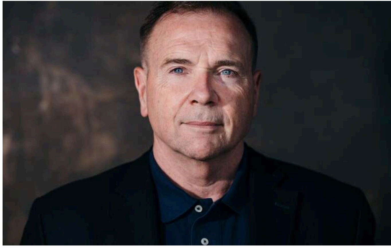
Судячи з усього, в Зеленського є карти, - Годжес про спецоперацію СБУ "Павутина"

Колишній командувач силами США в Європі Бен Годжес прокоментував спецоперацію Служби Безпеки України "Павутина".