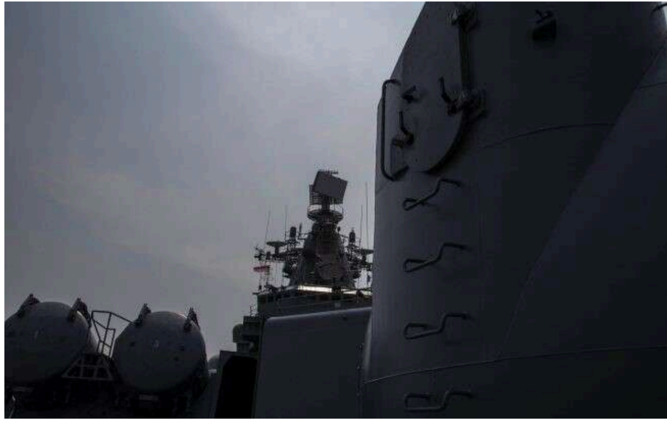
Росія вивела в Чорне море ракетносії з крилатими ракетами "Калібр"

Російські загарбники знову вивели ракетносії в море. Це створює високу загрозу ракетних ударів з моря, особливо для Одеської області.