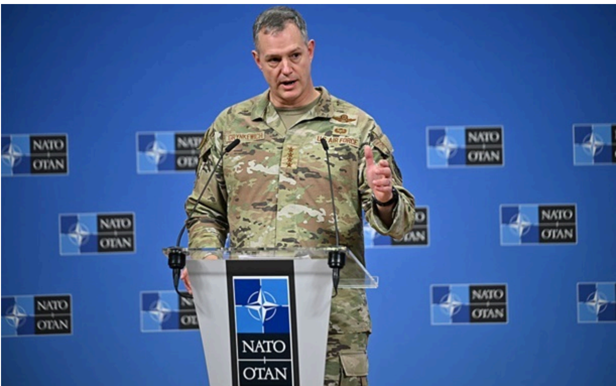
Верховний головнокомандувач Об'єднаних Збройних сил НАТО в Європі генерал Алексус Гринкевич

Алексус Гринкевич вважає, що Росія не шукає конфлікту і усвідомлює асиметричні переваги НАТО.