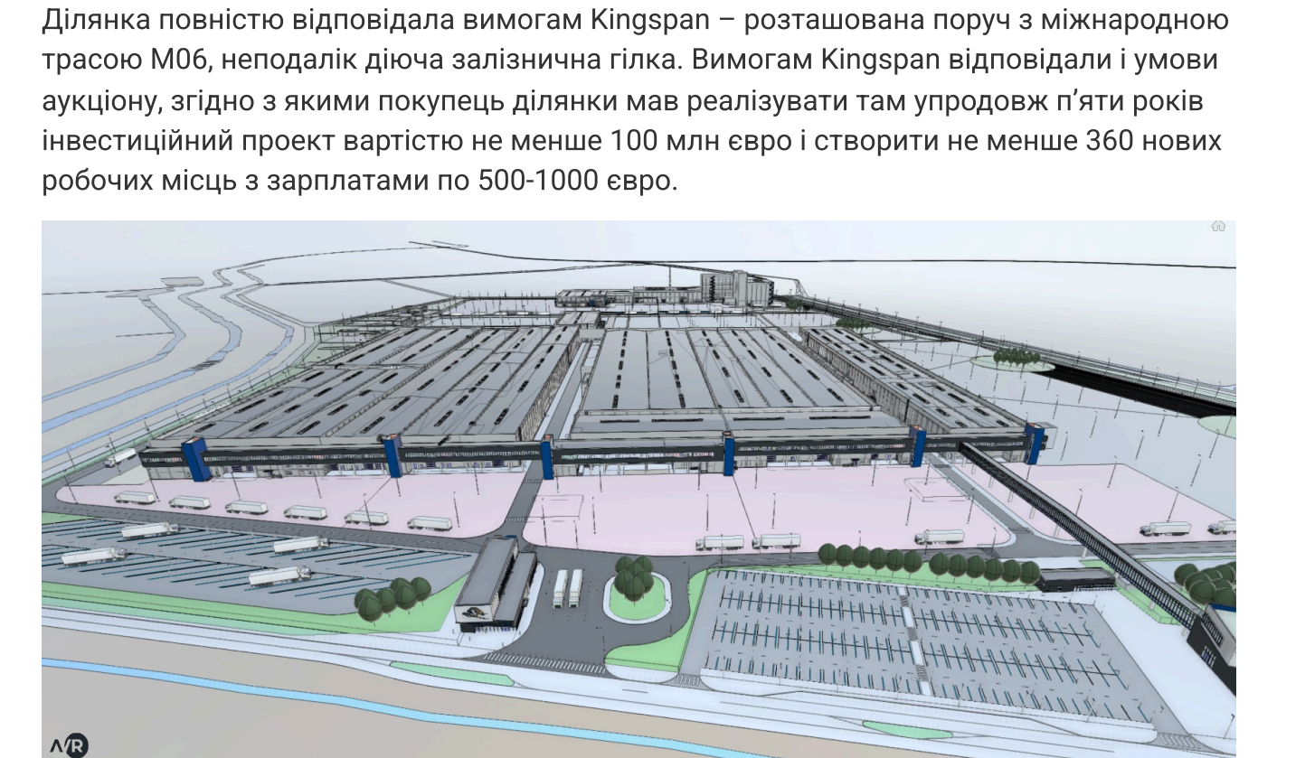
Схематичне зображення проєкту будівельного хабу Kingspan, що мав складатися відразу з кількох виробничих майданчиків, у селі Ямпіль біля Львова (візуалізація Delta Group)

Ділянка повністю відповідала вимогам Kingspan — розташована поруч з міжнародною трасою М06, неподалік діюча залізнична гілка. Вимогами Kingspan відповідали і умови аукціону, згідно з якими покупець ділянки мав реалізувати там упродовж п'яти років інвестиційний проєкт вартістю не менше 100 млн євро і створити не менше 360 нових робочих місць з зарплатами по 500-1000 євро.