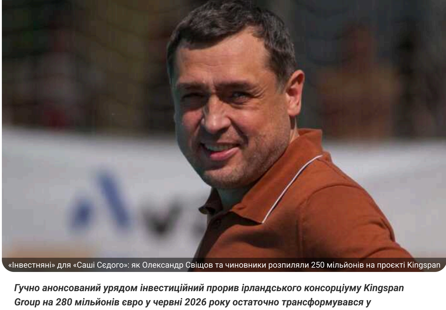
Гучно анонсований урядом інвестиційний проєкт ірландського консорціуму Kingspan Group на 280 мільйонів євро у червні 2026 року остаточно трансформувався у кримінальну справу НАБУ про розкрадання в особливо великих розмірах.

Як з'ясували розслідувачі NGL media, під наглядом офіційної державної «інвестняні» міжнародний гігант примудрився купити 50 гектарів приміської землі біля Львова втричі дорожче за її аукціонну вартість.