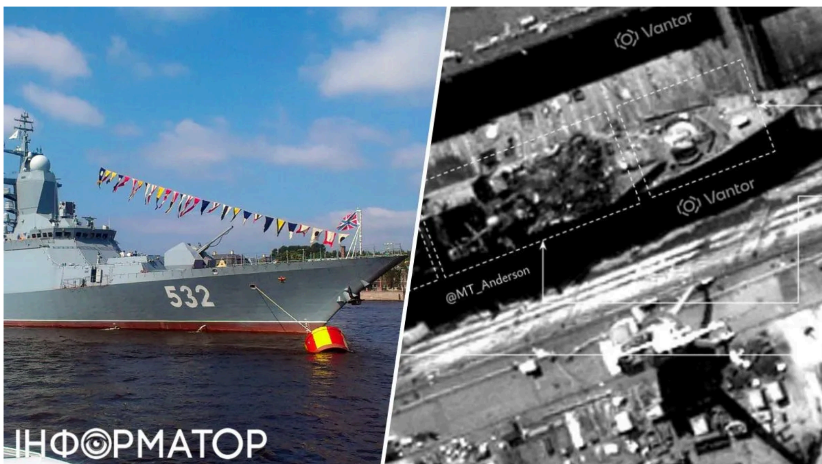
Корвет "Бойкий" знищено - фото з супутника

Супутникові знімки сухого доку в Кронштадті підтверджують, що російський ракетний корвет "Бойкий" проєкту 20380 зазнав незворотних руйнувань і не підлягає відновленню. Удар по Кронштадтській базі стався вранці 3 червня - тоді безпілотники атакували корабель під час планового ремонту. Масштаби пожежі були такими, що дим бачили за кілька кілометрів.