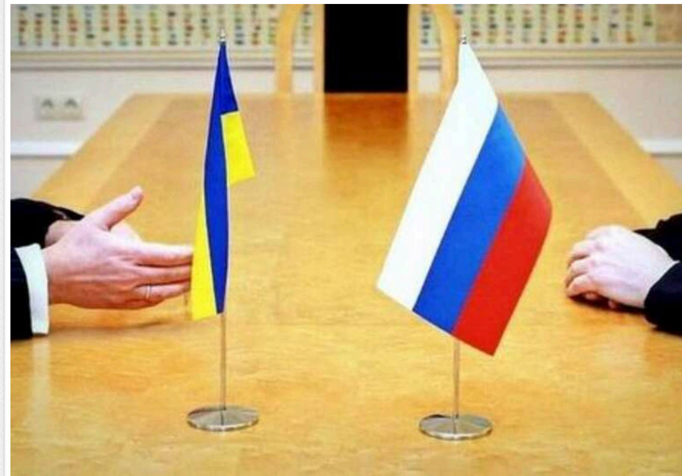
Кремль може готувати «основу» для зриву переговорів за допомогою диверсій у Брянській і Курській областях