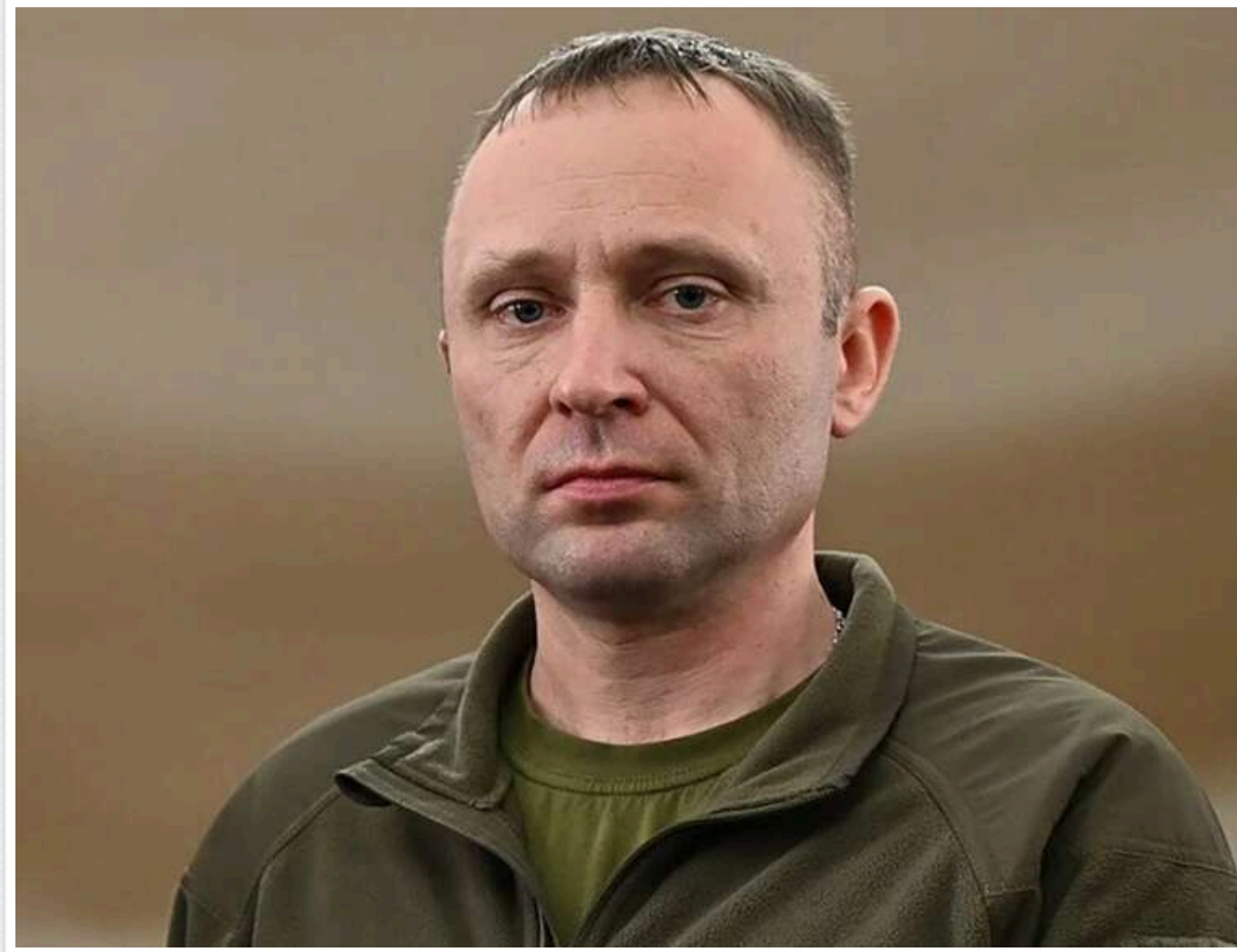
Командувач Сухопутних військ Драпатий подав заяву про вихід у відставку