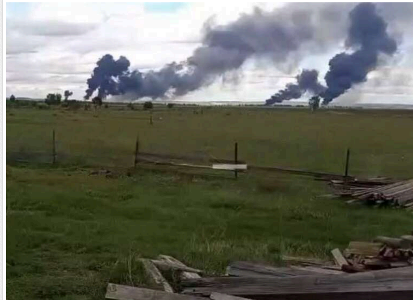
Попередньо також є влучання/знищення 3-х бортів Ту-95МС на авіабазі «Біла» в Іркутській області, - Tracking

Сюди було передислоковано більшу частину зі всіх Ту-95МС, які здійснювали пуски КР Х-101 по території України.