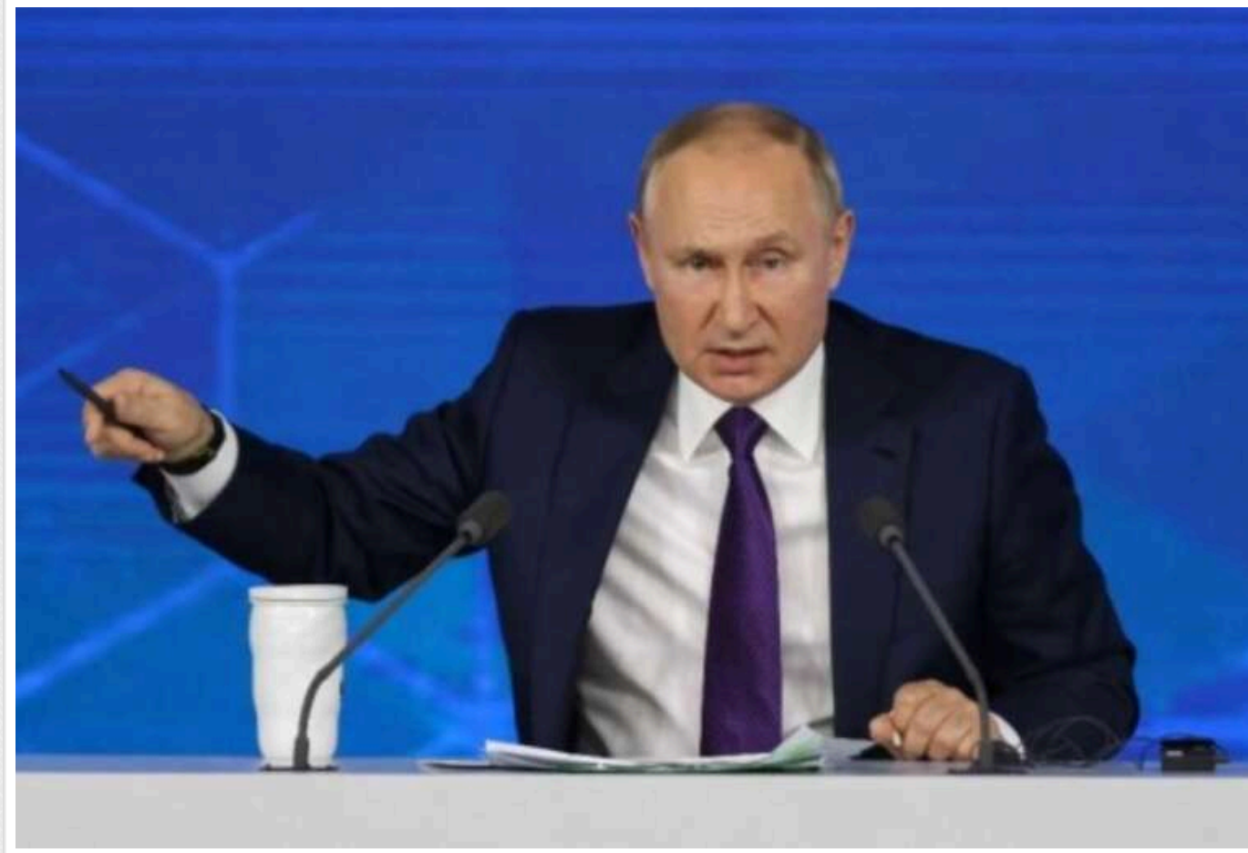
Кремль готується до затяжної війни з Україною і потенційного конфлікту з НАТО - ISW

Росія не відмовилася від намірів загарбати нові українські території й активно готується до довготривалого протистояння – як з Україною, так і з НАТО.