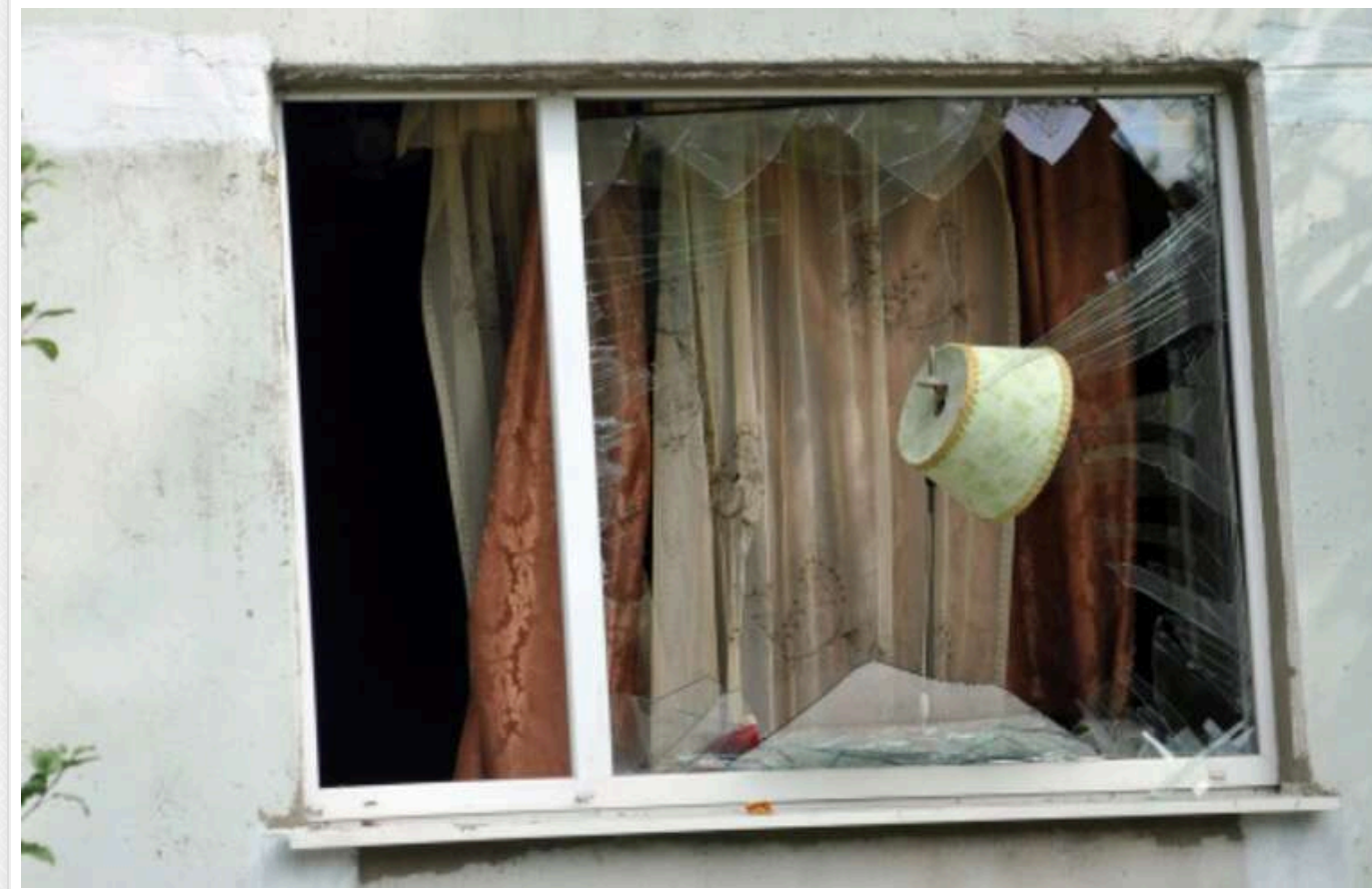
Унаслідок нічної атаки РФ у Житомирській області пошкоджено житлові будинки та підприємство

У Житомирській області минулої ночі внаслідок російської атаки пошкоджені зазнали приватні будинки та господарчі приміщення, підприємство.