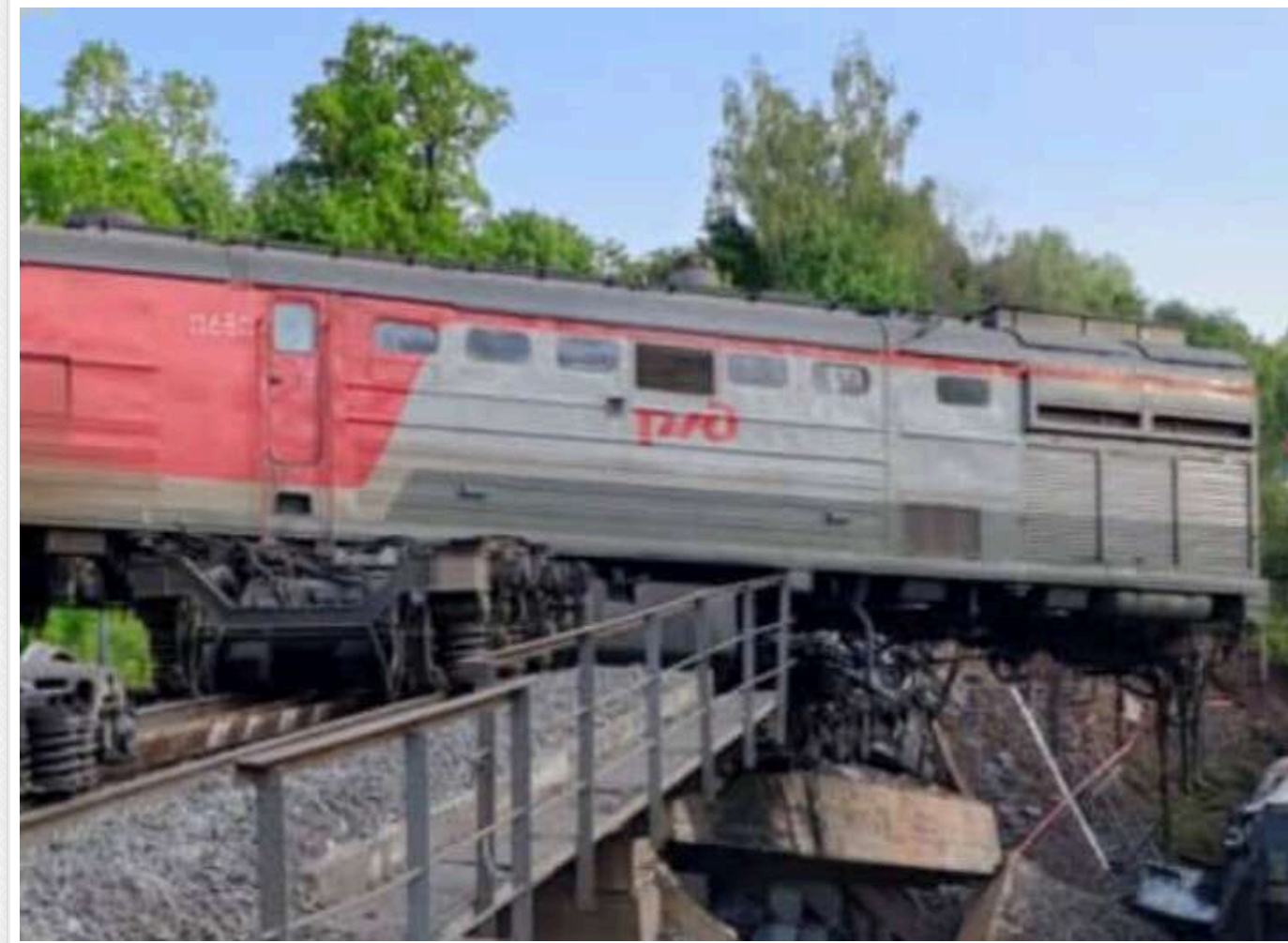
Російський СК видалив згадку про підриви на залізниці в Брянській і Курській областях

Слідчий комітет Росії відредагував своє офіційне повідомлення щодо інцидентів на залізниці у Брянській та Курській областях. З тексту зникла згадка про те, що причиною пошкоджень були саме підриви.