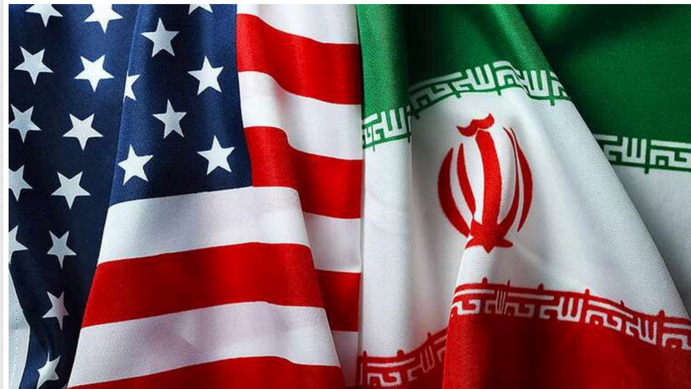
США передали Ірану першу офіційну пропозицію щодо ядерної угоди - NYT

США представили Ірану свою першу офіційну пропозицію щодо елементів ядерної угоди.