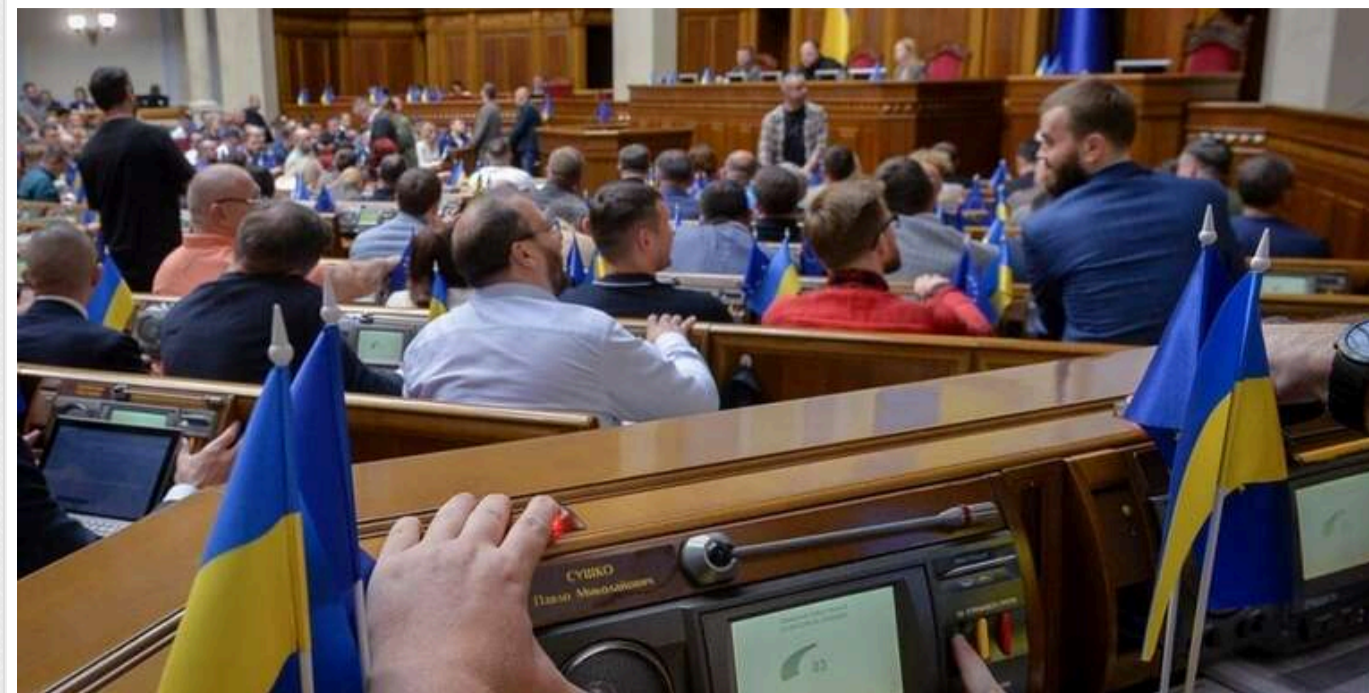
У Раді пропонують обмежити терміни зберігання даних у Реєстрі корупціонерів: відповідь на рішення ЄСПЛ

Термін зберігання даних про корупціонера в Реєстрі корупціонерів пропонують обмежити. Таким чином, на розгляд Верховної Ради подано ще один альтернативний законопроект 13271-2.