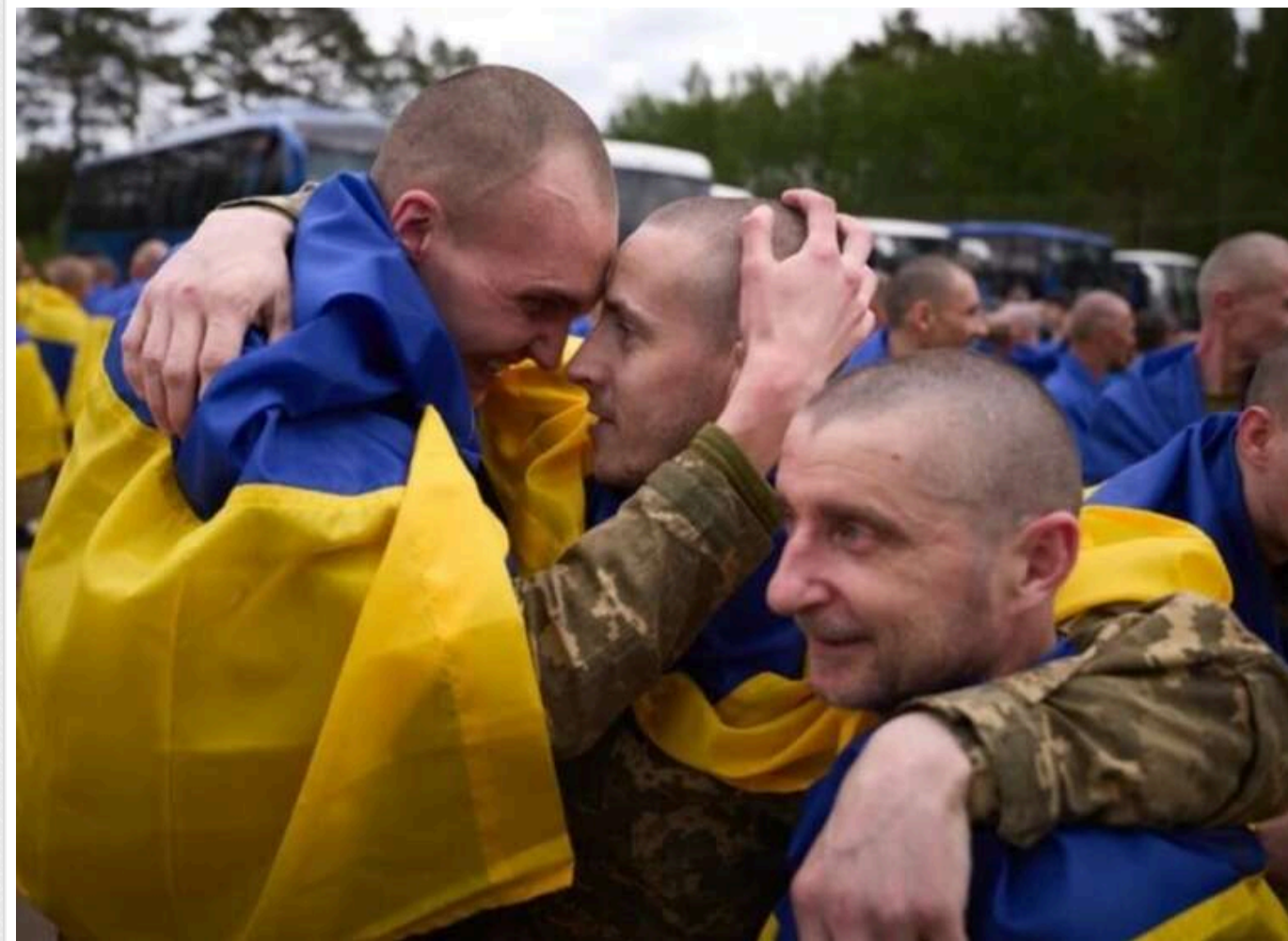
Росія розпоршує українських військовополонених по всій території та обмежує доступ до них, – Координаційний штаб

Читати на руском Read in English Додати як бажане джерело в Google