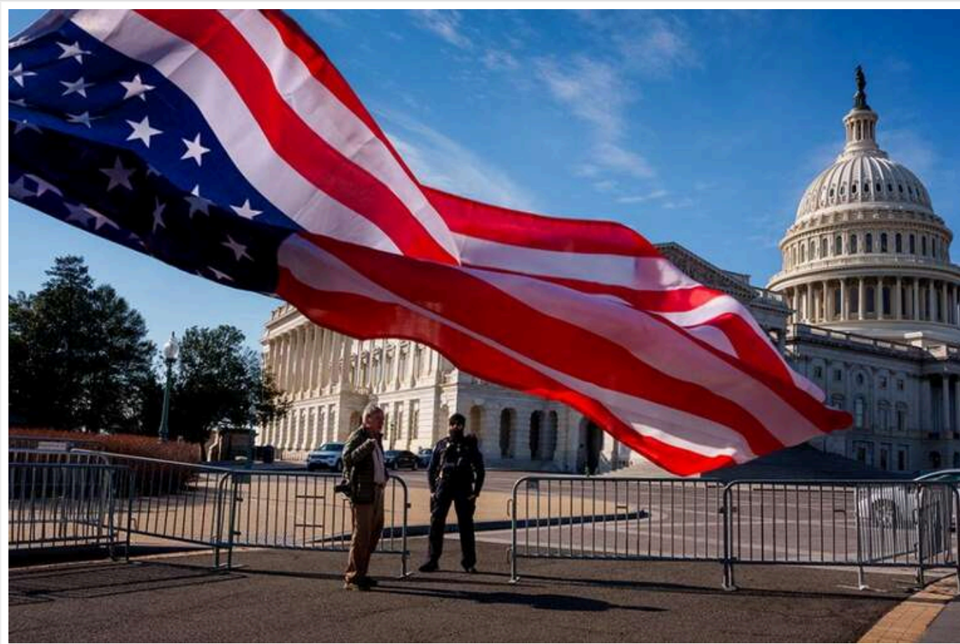
США не відправлять делегацію на другий раунд переговорів між Росією та Україною в Стамбулі, — The Atlantic

Джерела видання повідомляють, у Вашингтоні розглядаються два можливі сценарії розв'язку подій.