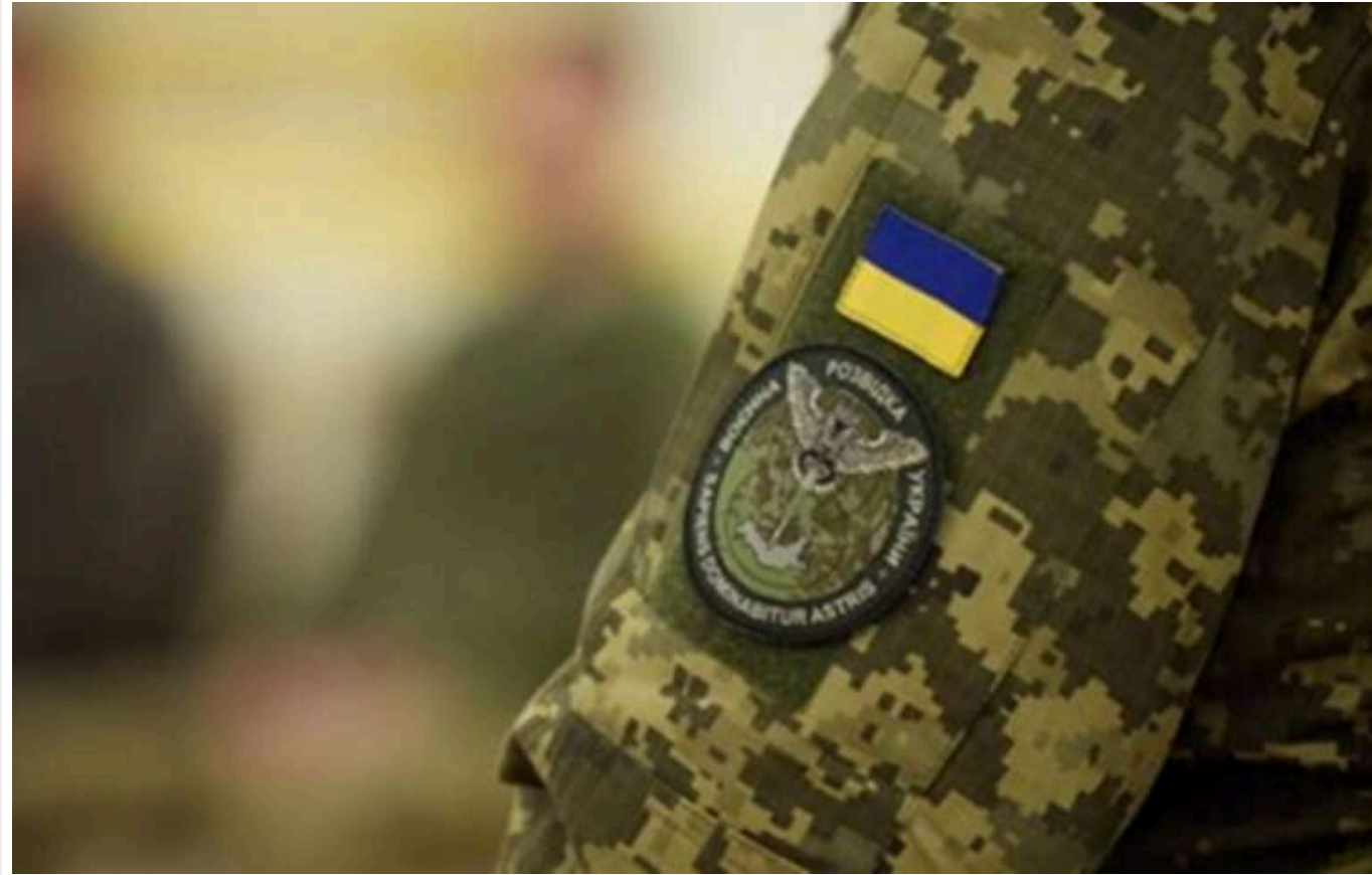
Вибухи в місці дислокації російських морпіхів у Владивостоці влаштували бійці ГУР МО

Читати на руськом Read in English Додати як бажане джерело в Google