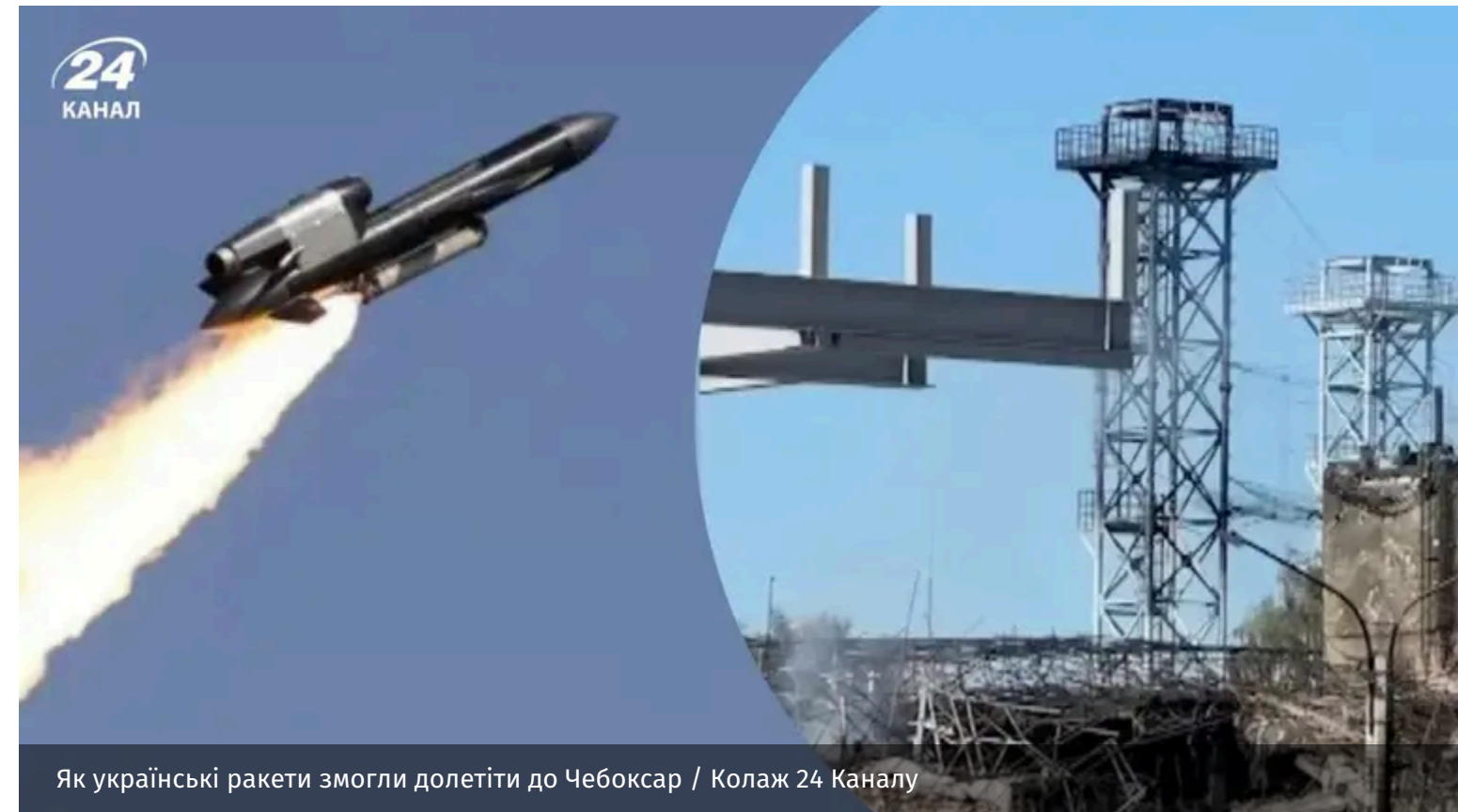
Як українські ракети змогли долетіти до Чебоксар / Колаж 24 Каналу

В ніч на 10 червня Україна атакувала російське підприємство у Чебоксарах. До цілі долетіли 2 з 5 українських ракет "Фламінго". Це доводить, що історія з "могутньою російською ППО" закінчилась.